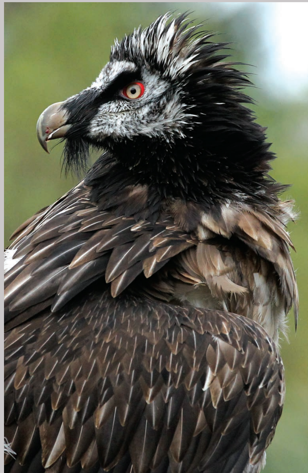
Lammegribbens udseende er dramatisk.

Hvilket er ret heldigt. Nu behøver vi ikke vente hundrede år på at komme helt tæt på den frygtindgydende og fascinerende rovfugl: Dragen er landet på Ørnereservatet.