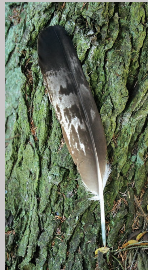
Kongeørnefjer, der skulle have stor healende kraft.