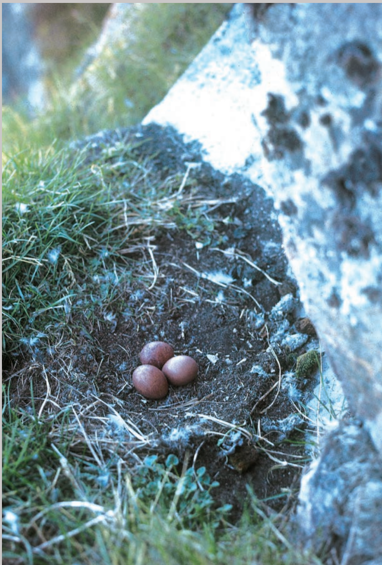
Vandrefalks rede på klippeskråning.