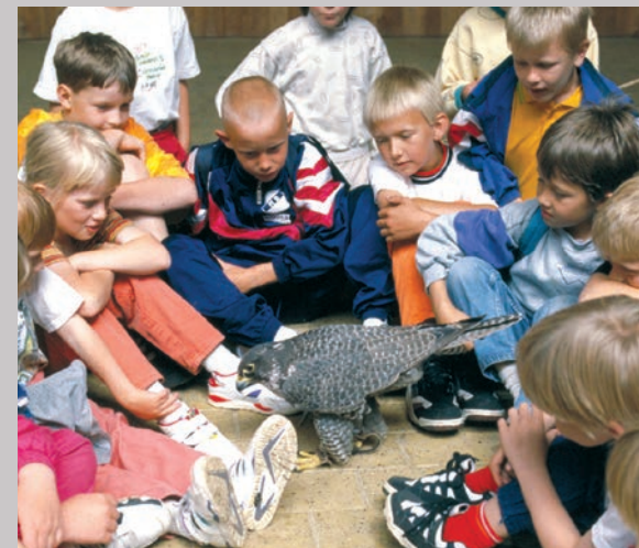
Sultana mellem børn.

Så skulle du alligevel mærke et kraftigt vingesus strejfe din kind på stranden, så kan det være én af Sultanas mange efterkommere, der har arvet hendes evne til at forundre, forskrække og betage menneskene.