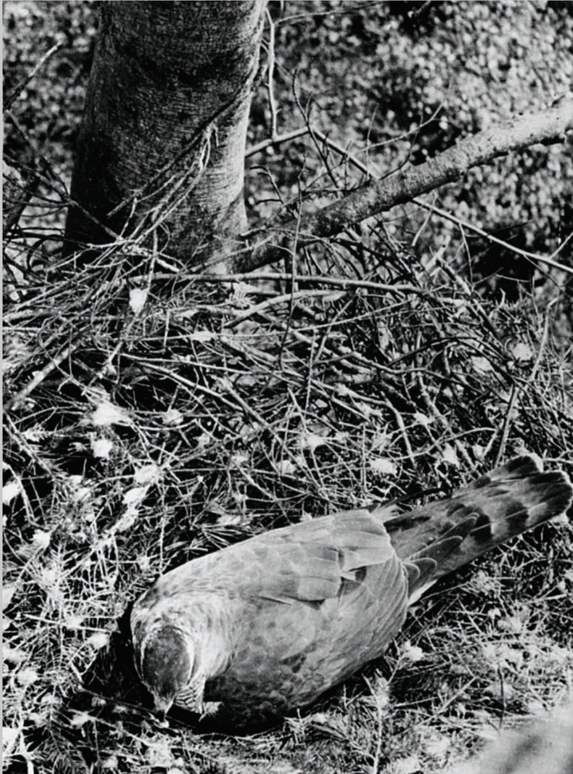
Billede taget med Franks selvudløser i 1954.