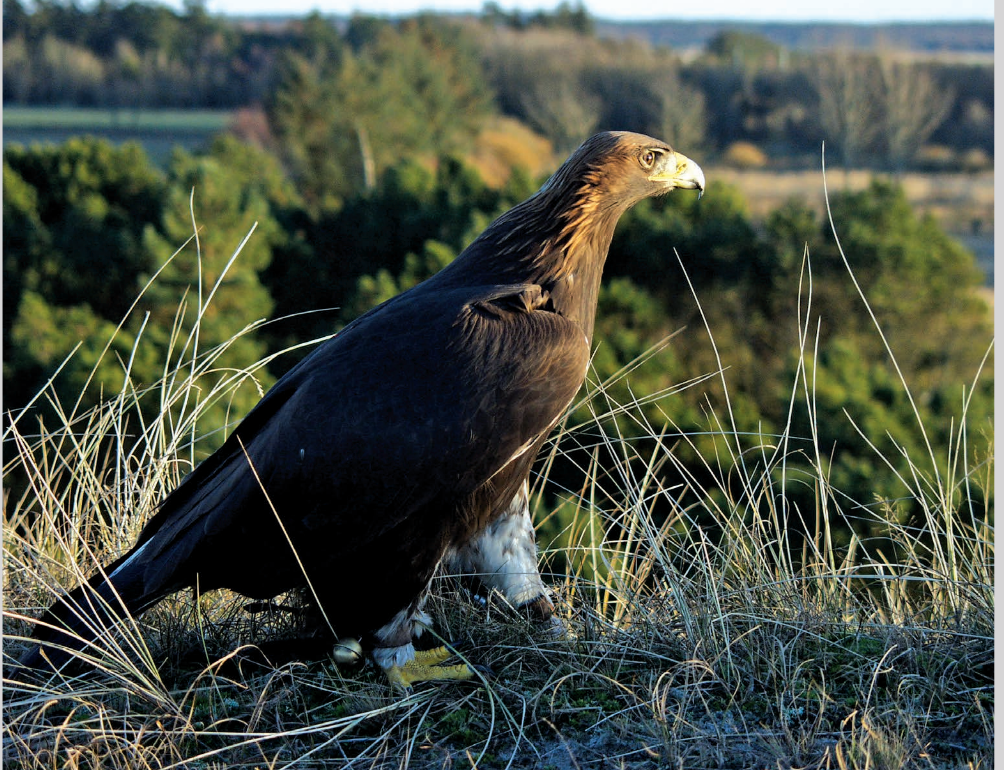
Ung kongeørn på klitterne ved Ørnereservatet.