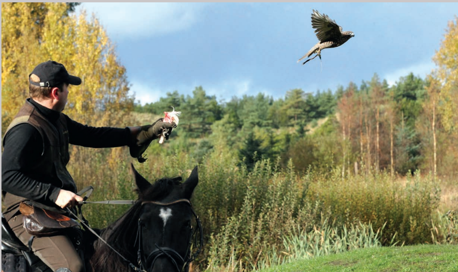
Ung jagtfalk kaldes tilbage til rytteren.