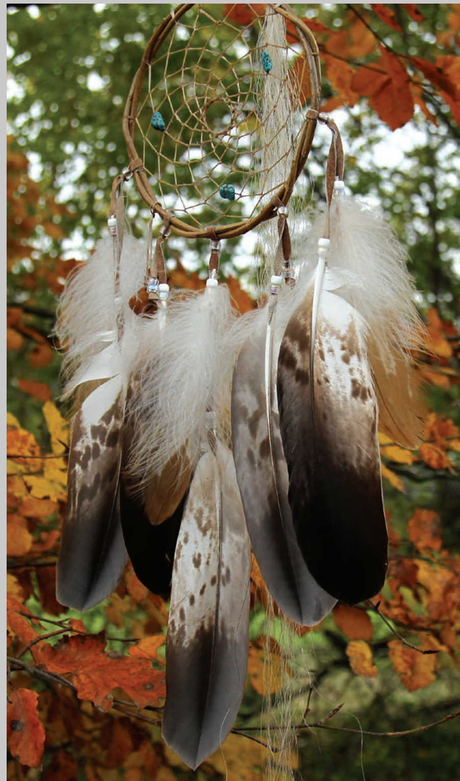
Drømmefanger med kongørnefjer.

Du kan se fotografier af Bear Heart på Ørnereservatets udstilling. Ørnefjerne indsamles og gives væk til en kvinde, der laver drømmefangere efter traditionel amerikansk skik.