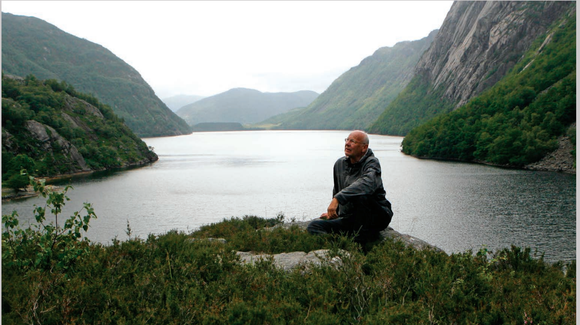
Frank nyder Nordnorges uspolerede natur.