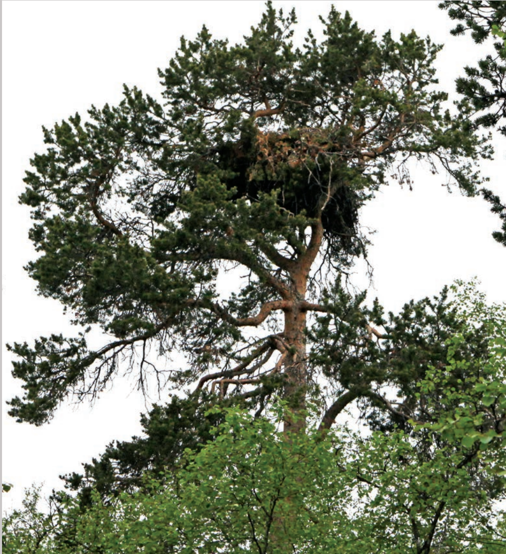
Den tre meter store kongørnerede