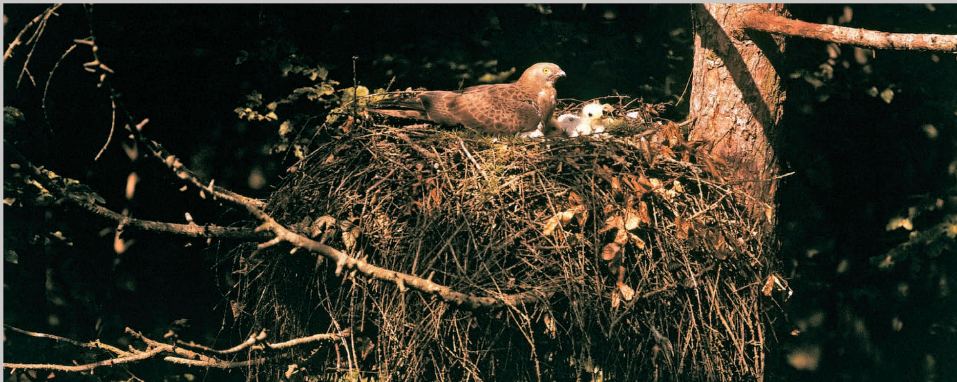
Hvæpsevågerede, der faldt ned under stormen.