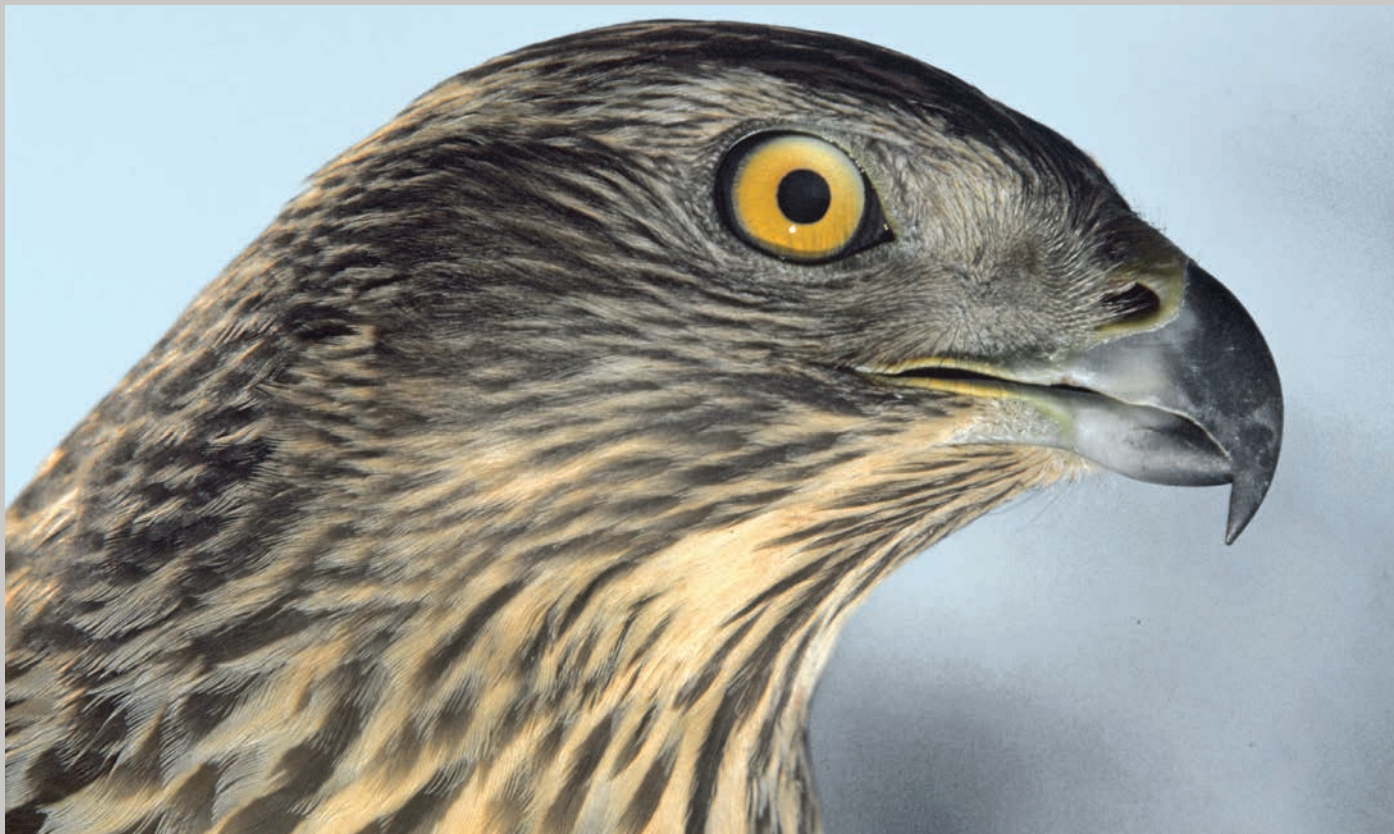
Ung duehøg med gule øjne. Med alderen bliver de røde.

Intet byttedyr kan vide sig sikker, når den kompromisløse og brutale duehøg er i nærheden. Frank har altid været utrolig fascineret af dens dræberinstinkt og fantastiske fysik.