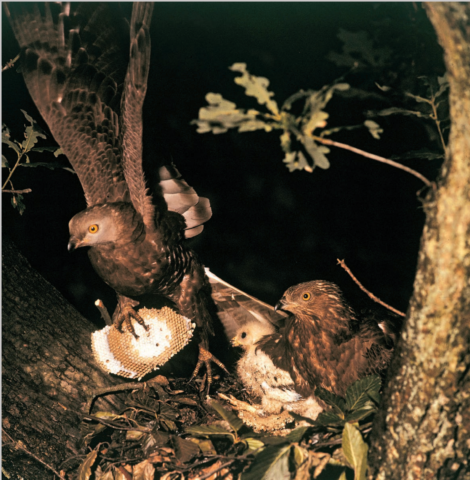
Hannen på vej væk fra reden med et hvepsebo i kloerne.