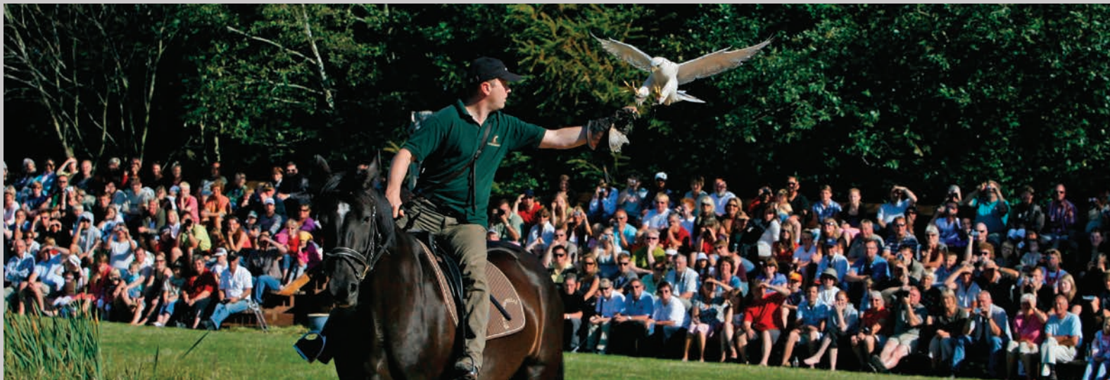
Træning med hvid jagtfalk foran publikum.