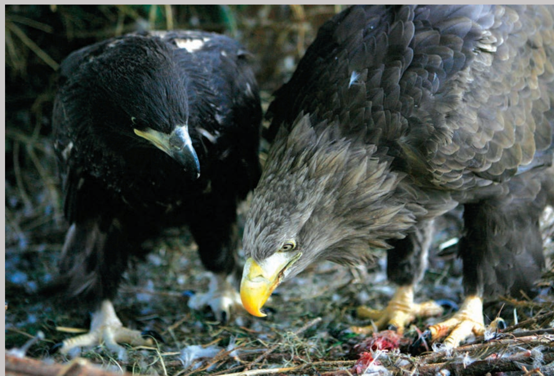
Margrethe er blevet en omsorgsfuld og flittig mor med årene. Her ses hun fodre sin unge fra 2010.