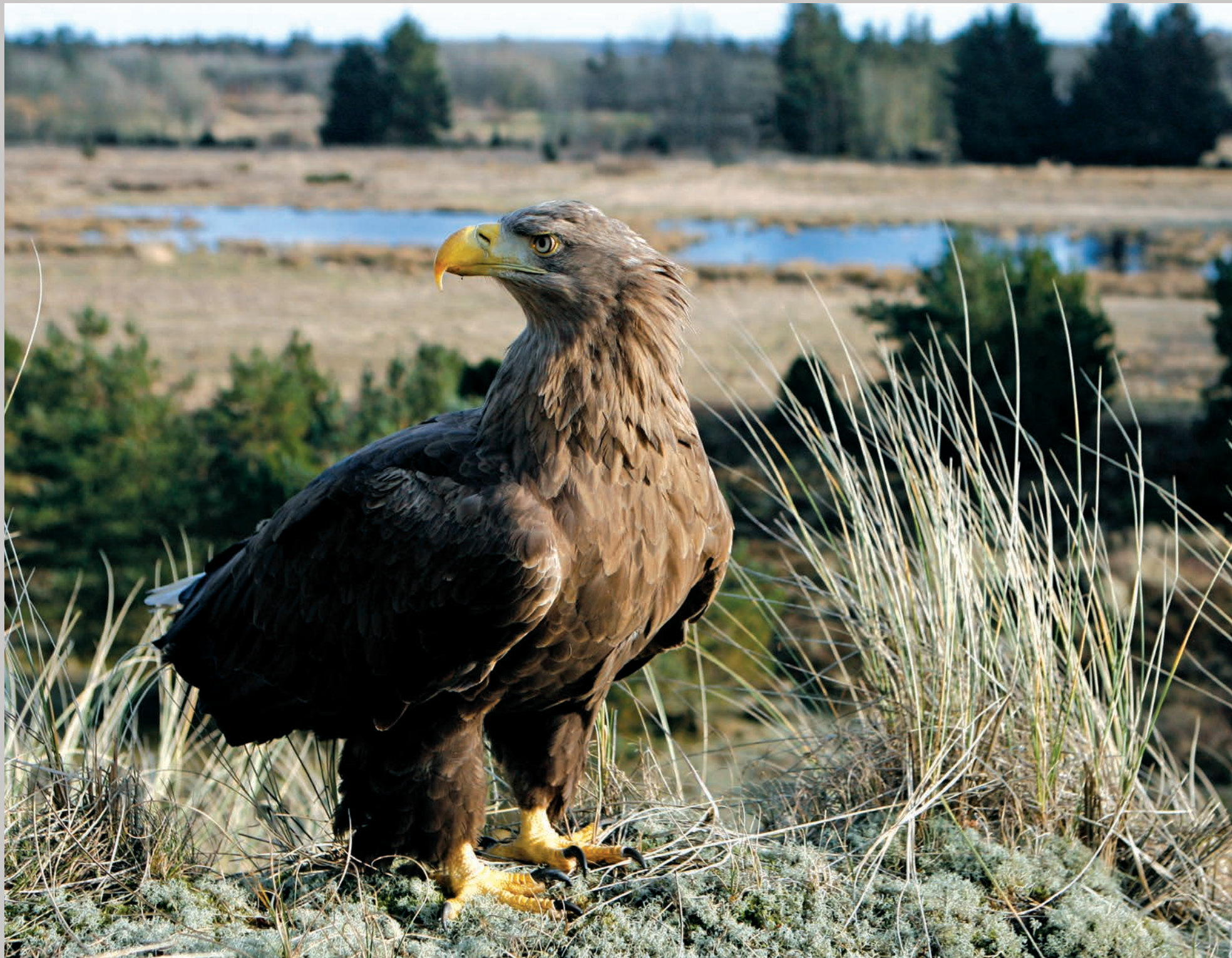
Margrethe kigger ud over Ørnerservatet.