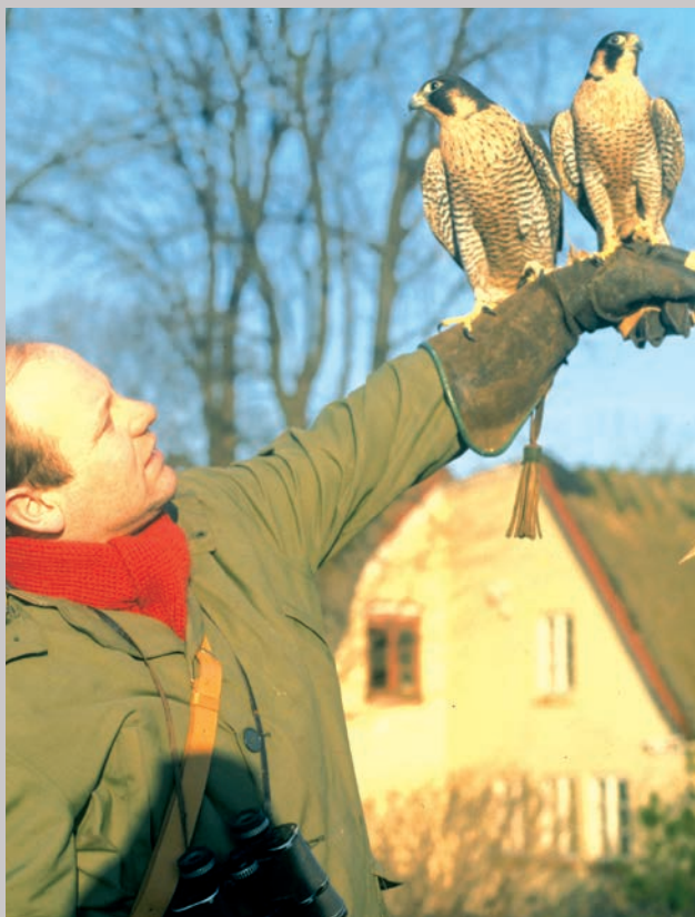
De to vandrefalke, der kom tilbage til en tryggere tilværelse i Grønland.