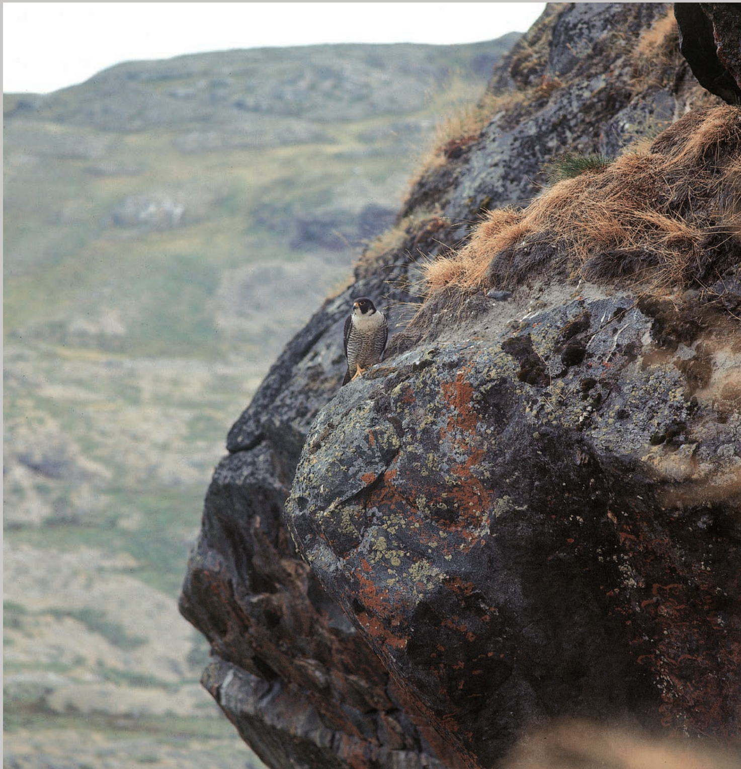
Vandrefalkehunnen med det grønlandske landskab bag sig.