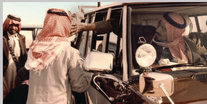
Kongen i sin ørkenbil. Han kærtegner falken.