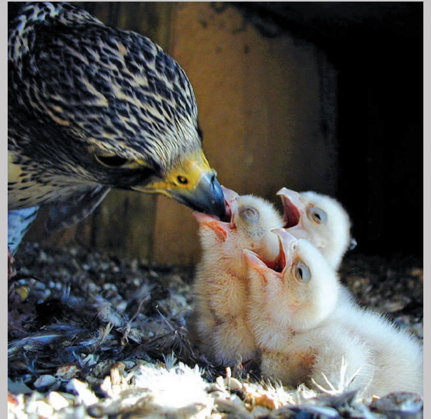
Islandsk jagtfalkehan, der fodrer sine unger.