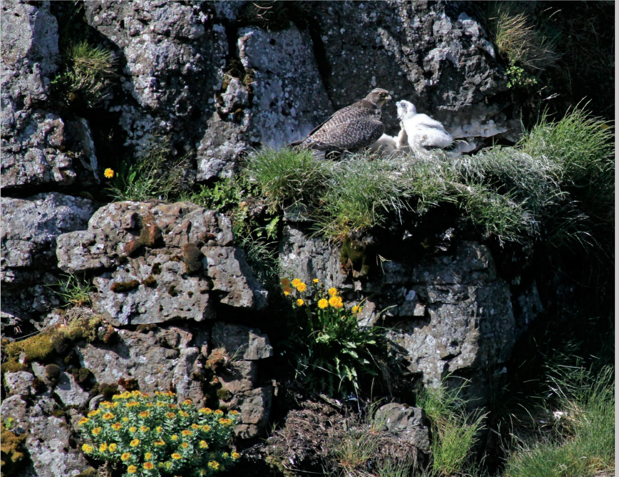
Islandsk jagdfalkelokalitet. Hunnen fodrer sine 20 dage gamle unger.