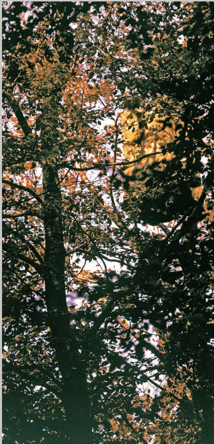
Franks skjul højt oppe i træet.