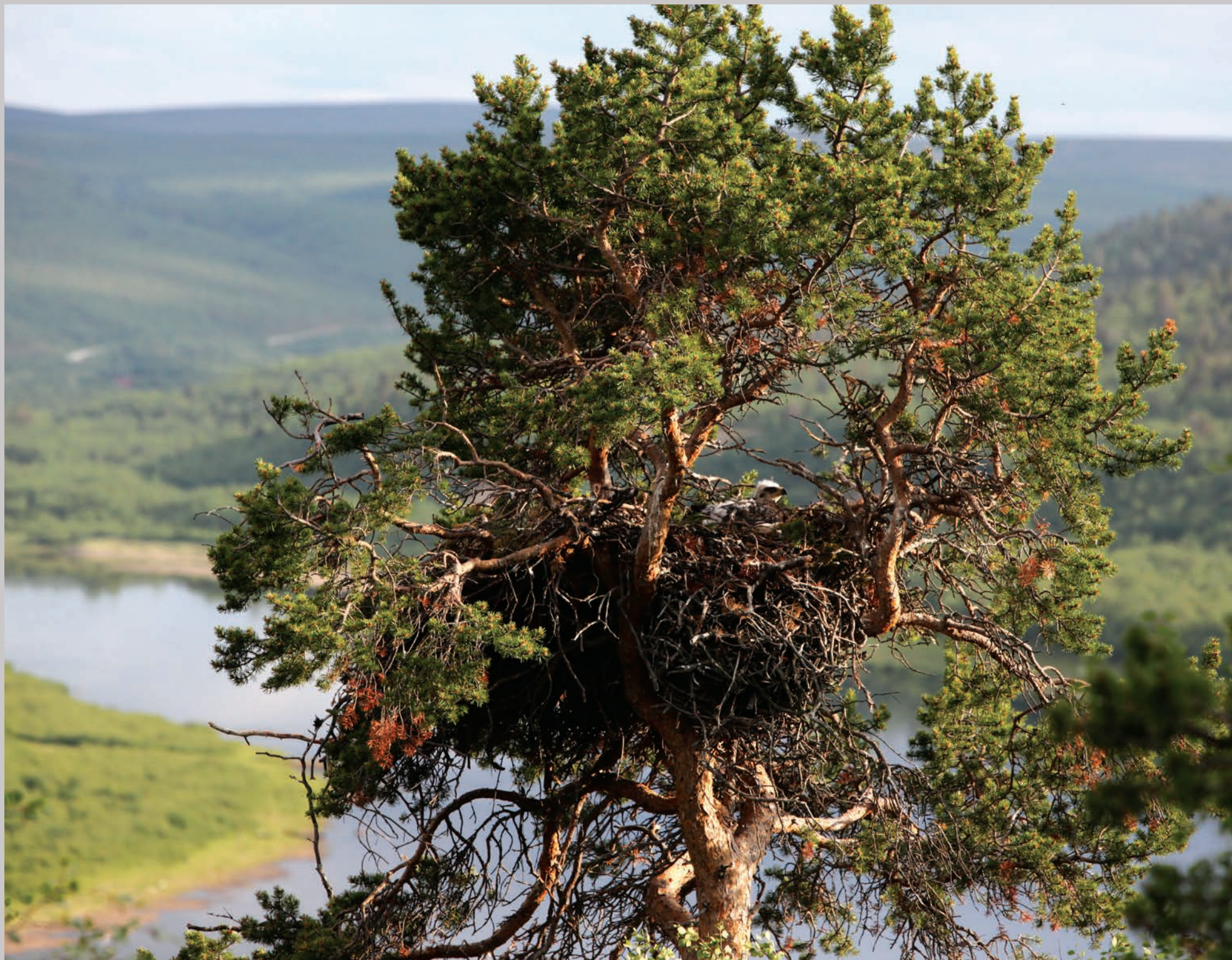
Reden kunne ikke være placeret smukkere.