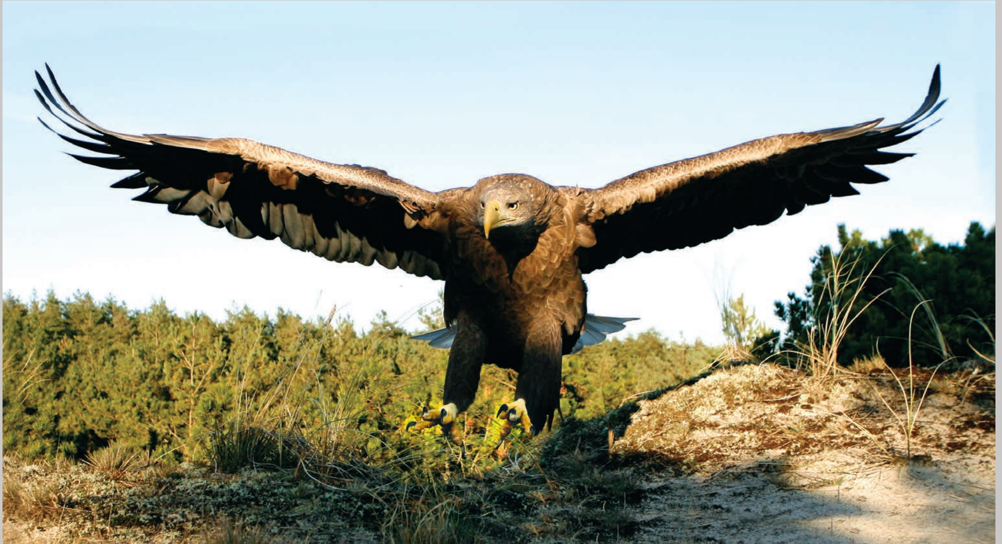
Margrethe lander på klitterne.