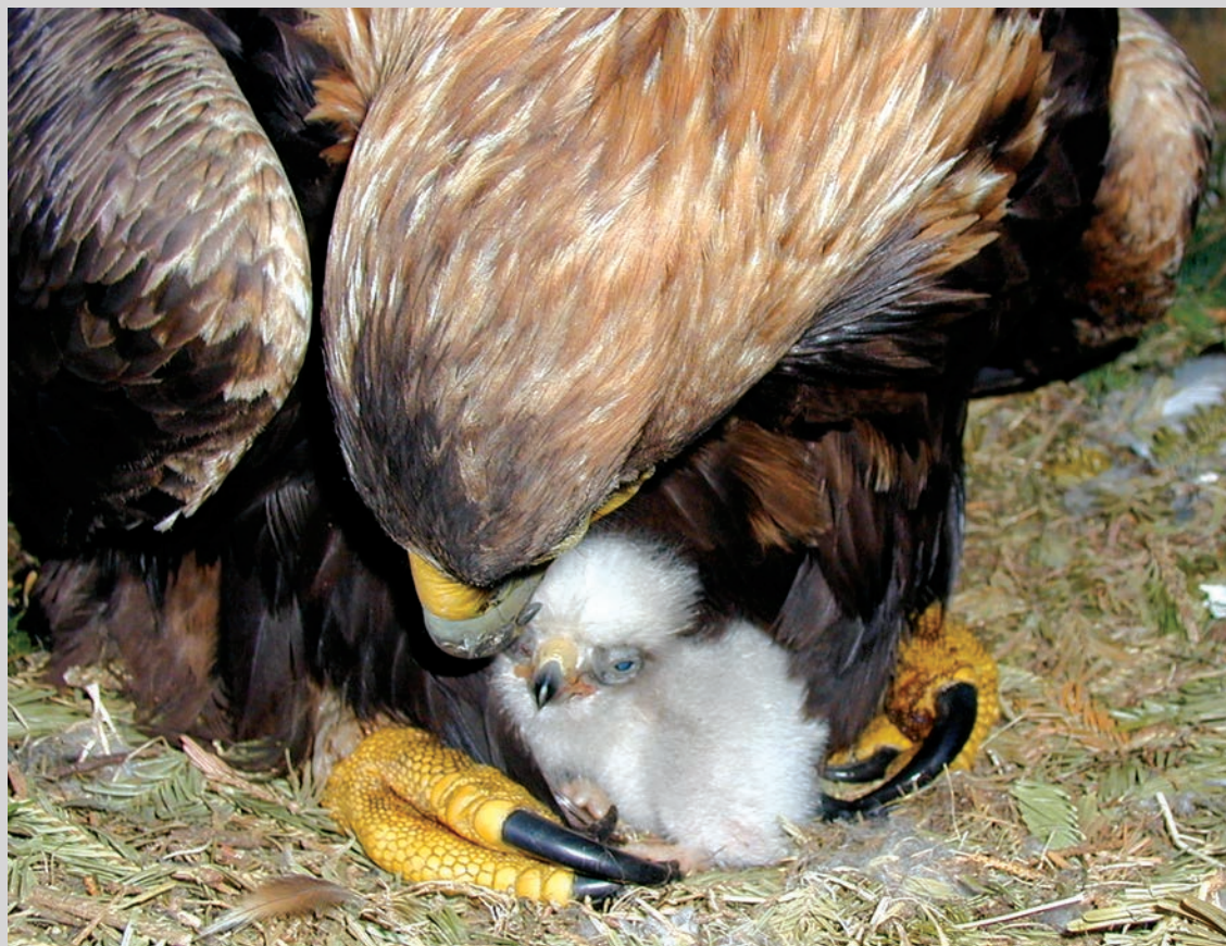
Kongeørnen er nænsom med ungen.