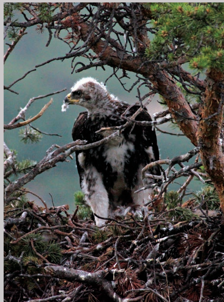
Den store unge kigger efter sine forældre.

- De kan virkelig skabe ballade. Forældrene holder sig væk i lang tid, ungerne sulter og går løs på hinanden, eller forældrene forlader reden helt. Det er en forkastelig måde at få billeder på i den vilde natur.