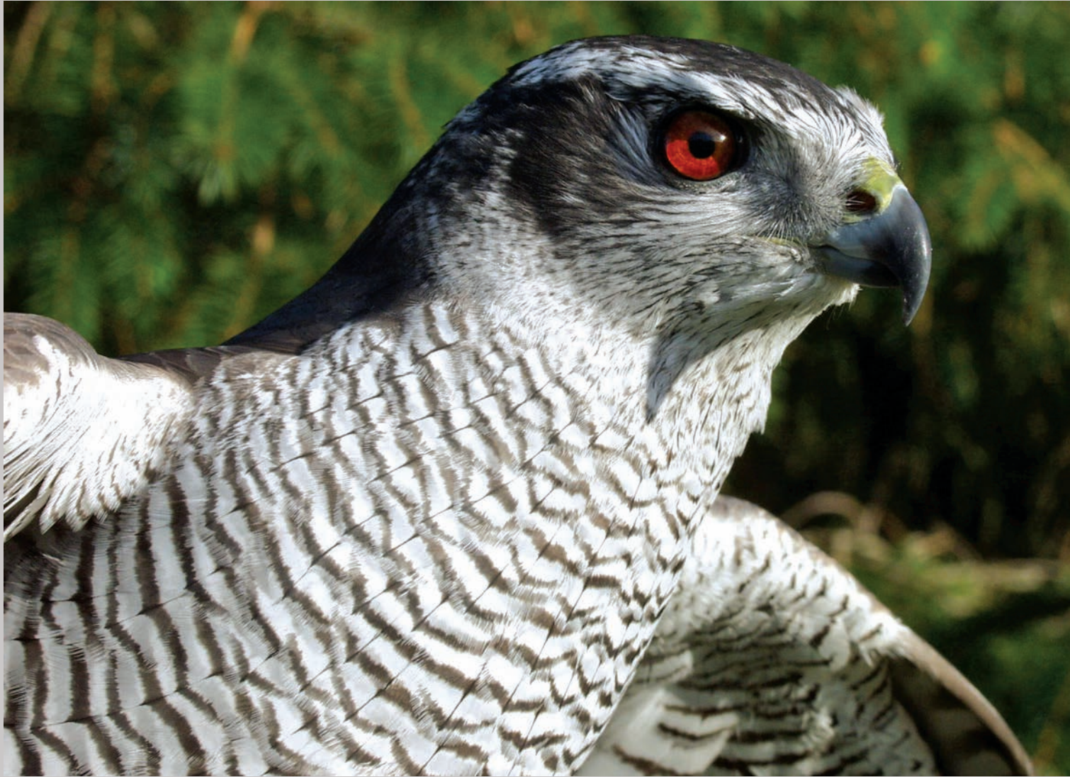
Voksen duehøg med røde øjne.