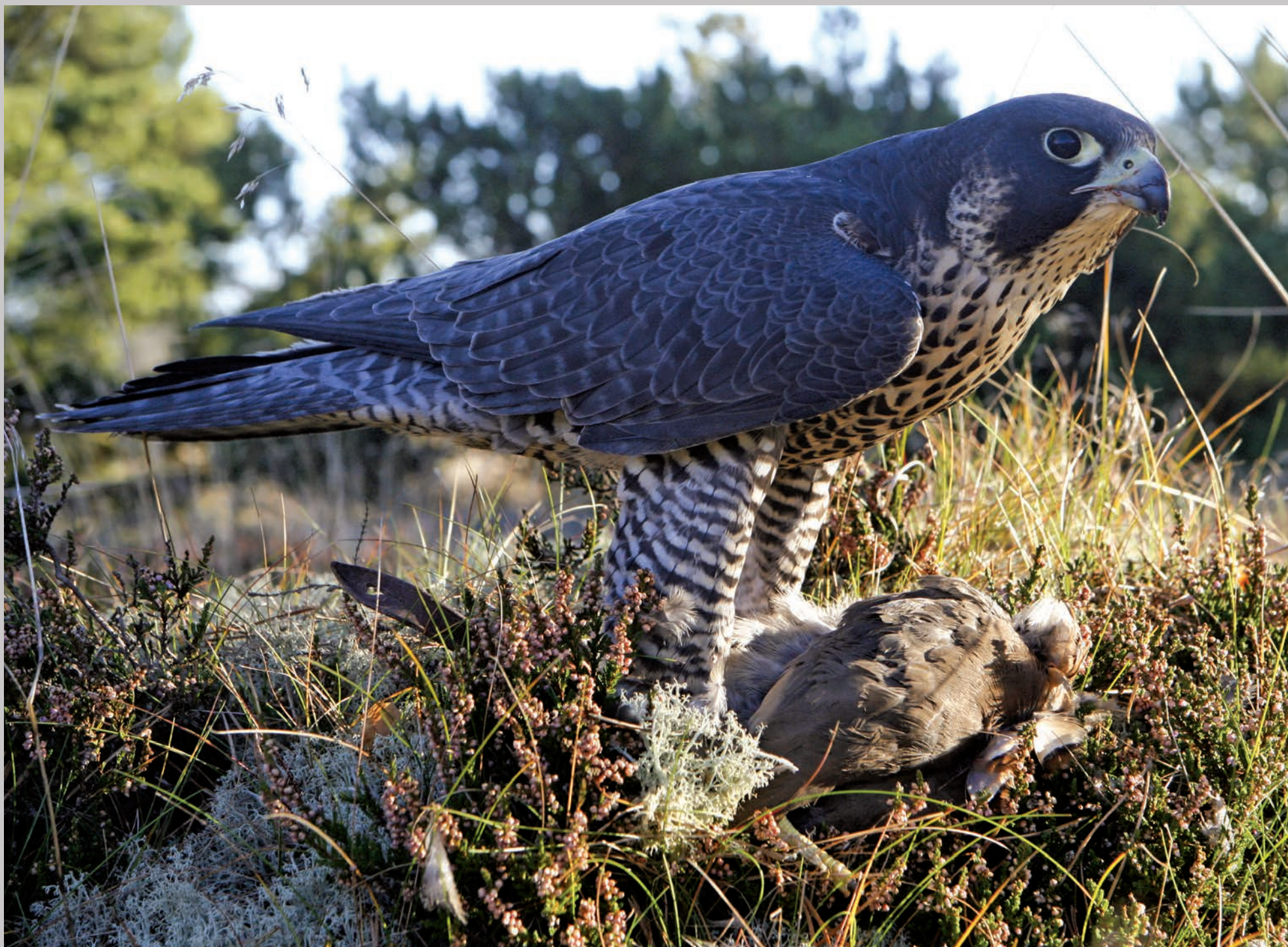
Vandrefalk med bytte.