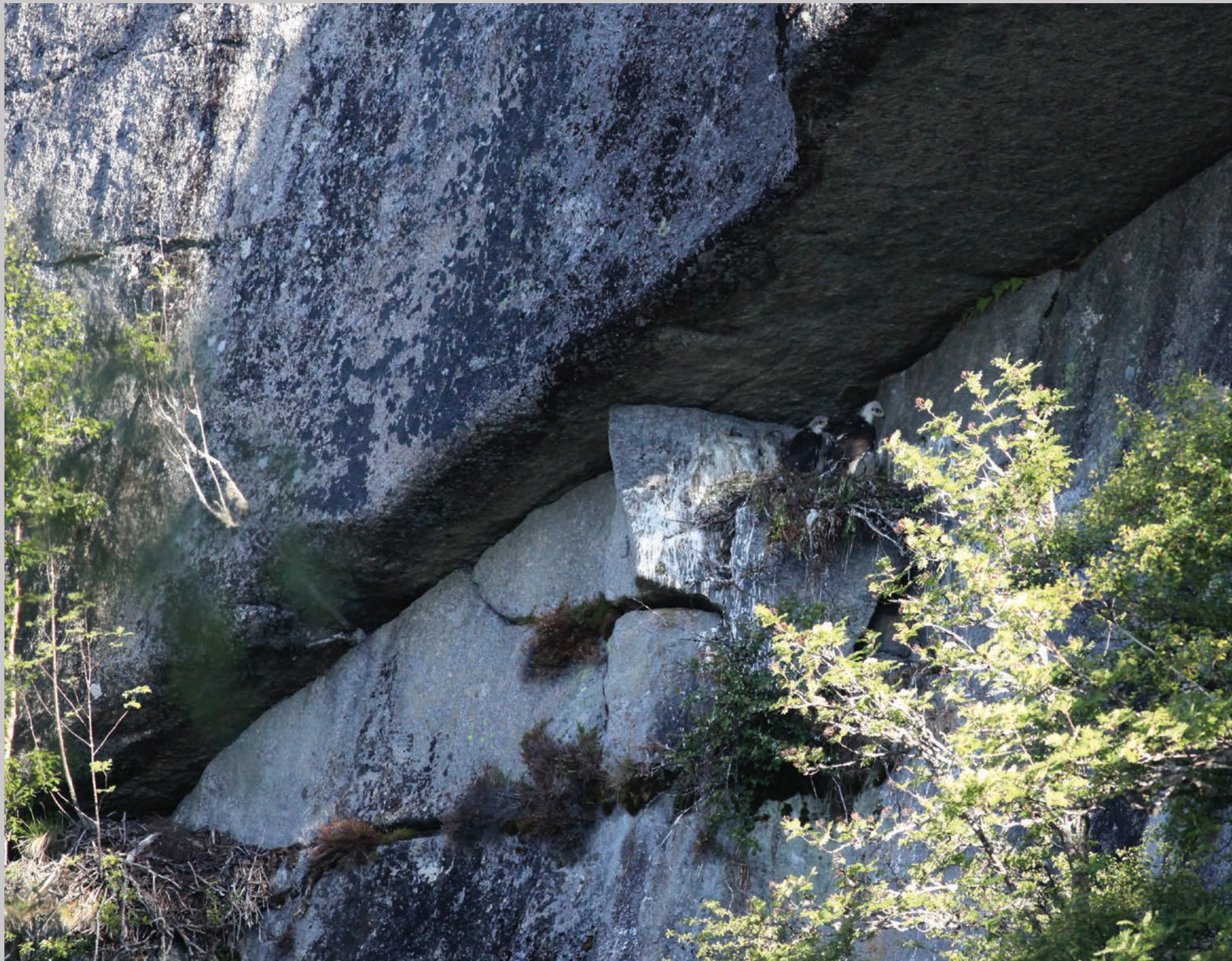
Stor klippe med lille, nybygget kongeørnerede. De to store unger sidder tæt og er et levende bevis for, at kongeørneunger bestemt ikke kæmper og slår hinanden ihjel. Nederst i venstre side: Oprindelig rede, hvor et træ er vokset op og forhindrer ørnernes indflyvning.