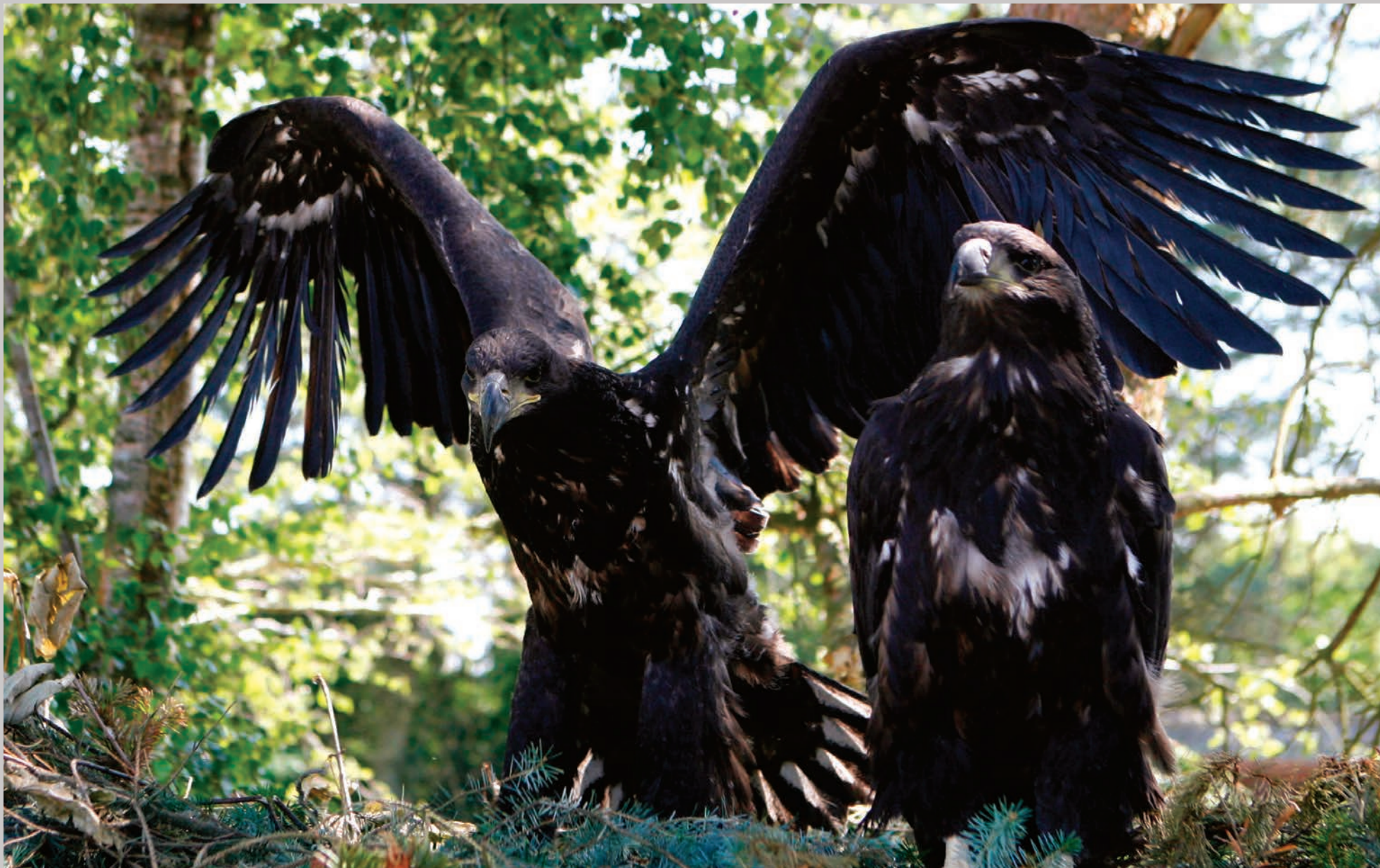
Rede med to næsten voksne havørneunger, der over sig på at bruge vingerne.