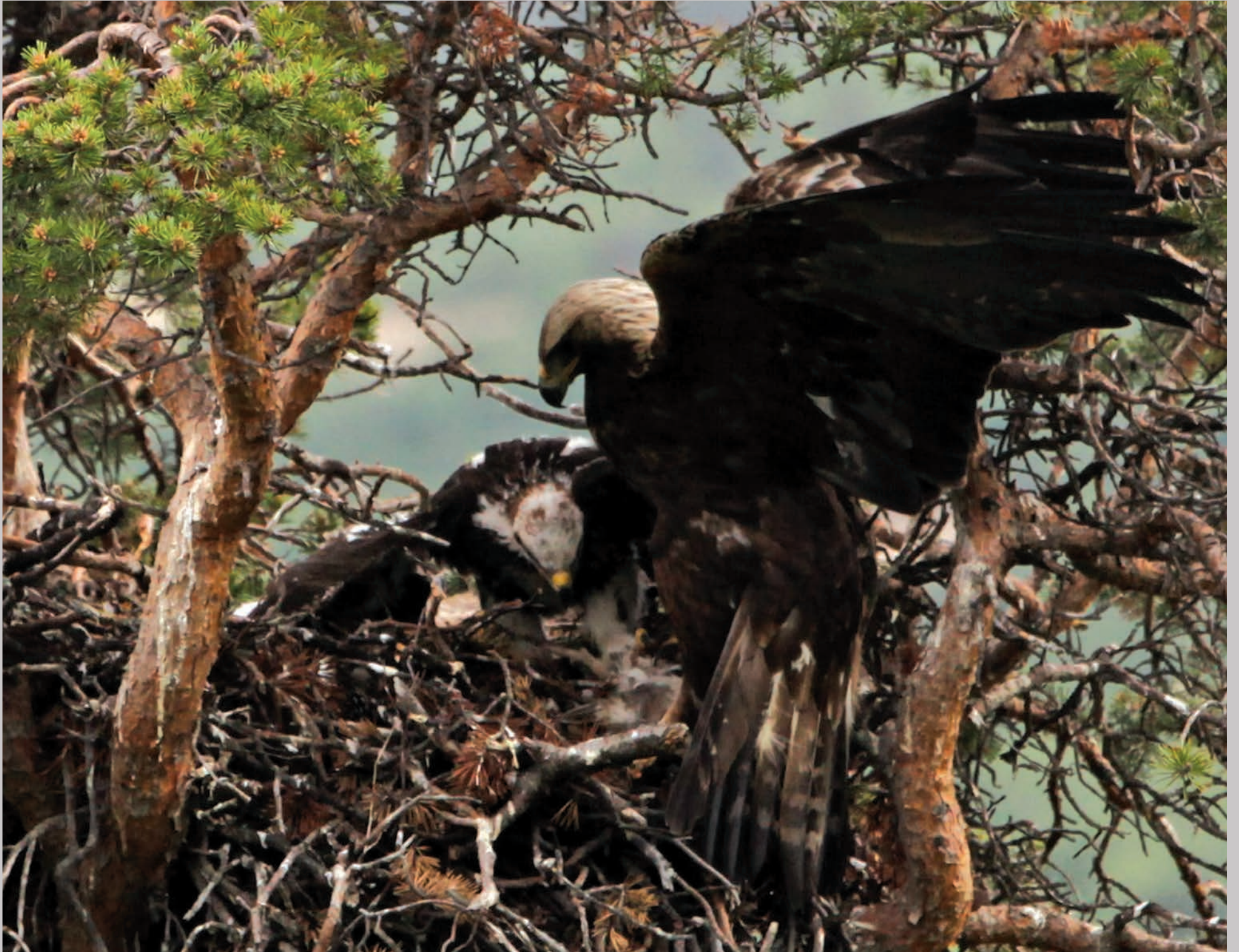
Kongeørnehannen kommer ned til reden med en fjeldhare, som ungen kaster sig over.