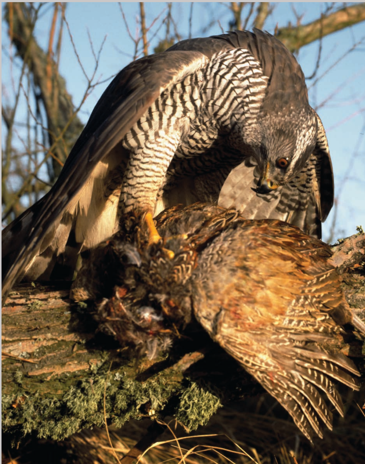
Duehog med dræbt fasan i klørne.