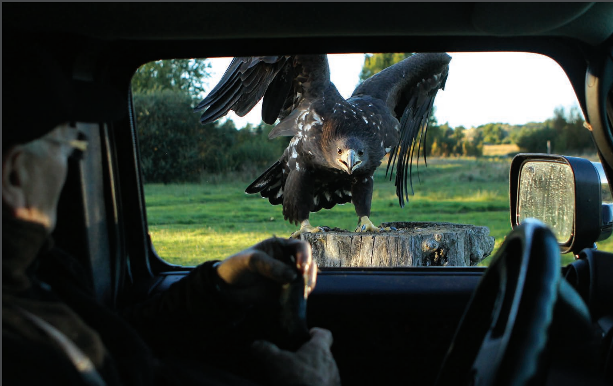
En af havorneungerne, som er vældig interesseret i Hummeren. Bilen betragtes af havornene som en stor, sort sten, der flytter sig. De morer sig med at flyve efter og lande på den.