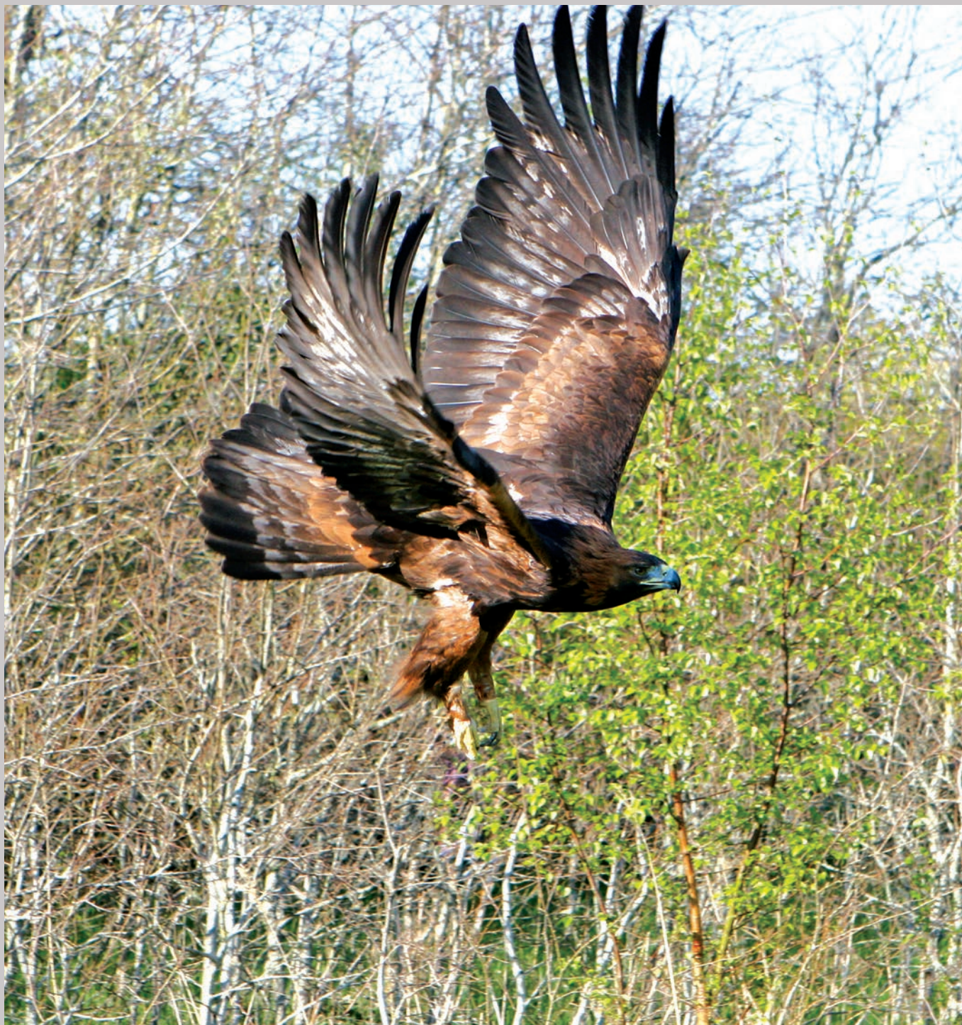
Kongeørnen har bredt sine pragtfulde vinger ud.