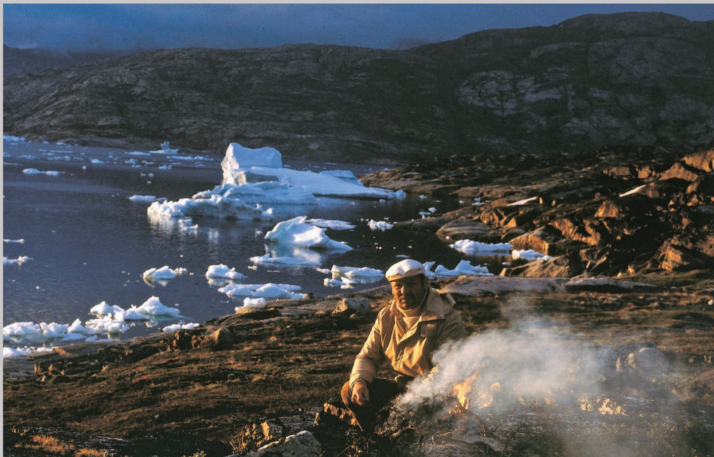
Grønland i midnatssol.