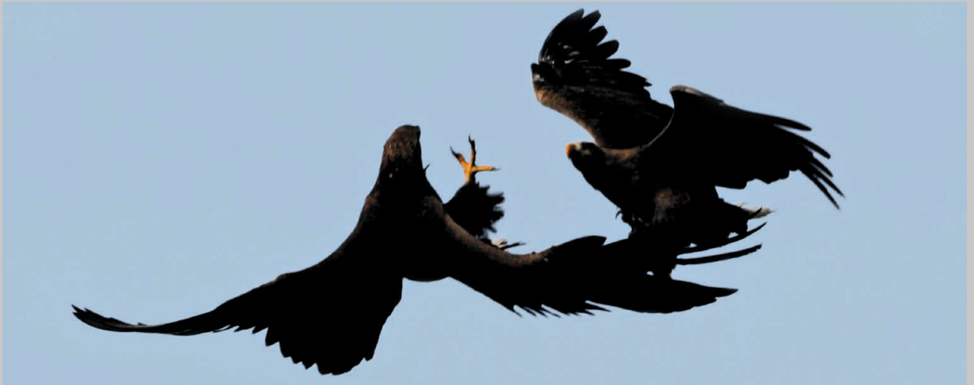
Havørne i kamp