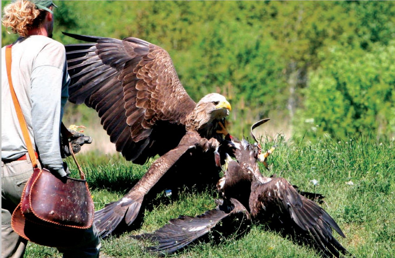
Falkoneren på vej for at adskille de rasende hunner.