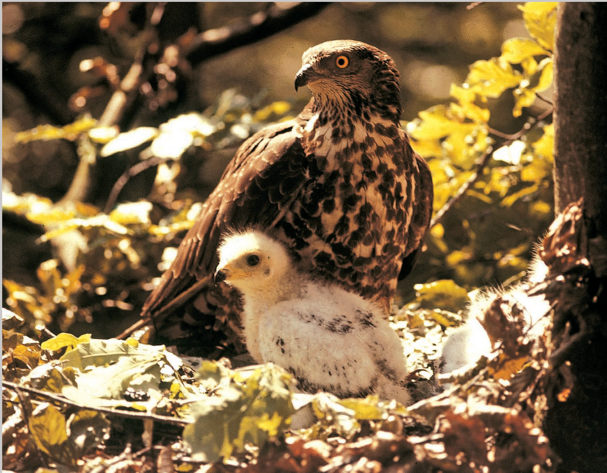
Hveosevågehunnen, der jagede sin hjemløse rivalinde bort, som havde mistet sine egne unger.