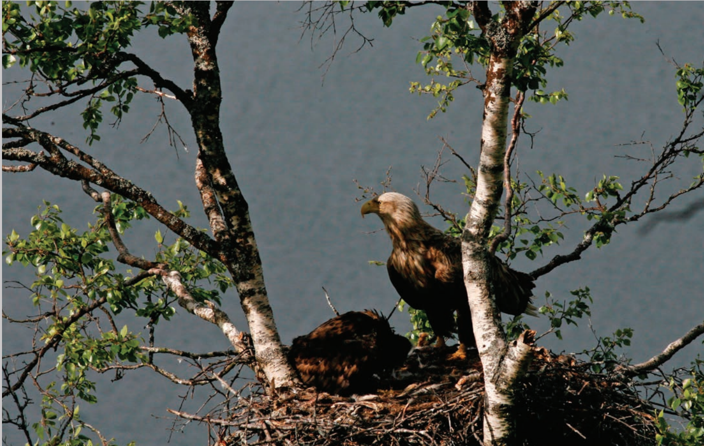
Nordatlantisk havørn er kommet med bytte til sin store unge.