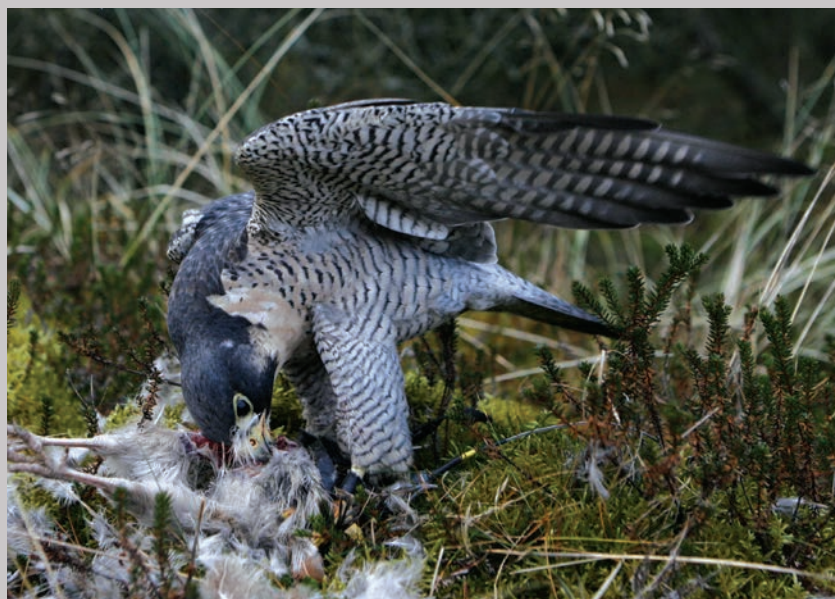
Vandrefalkens kloer, som har grebet fat i byttet.