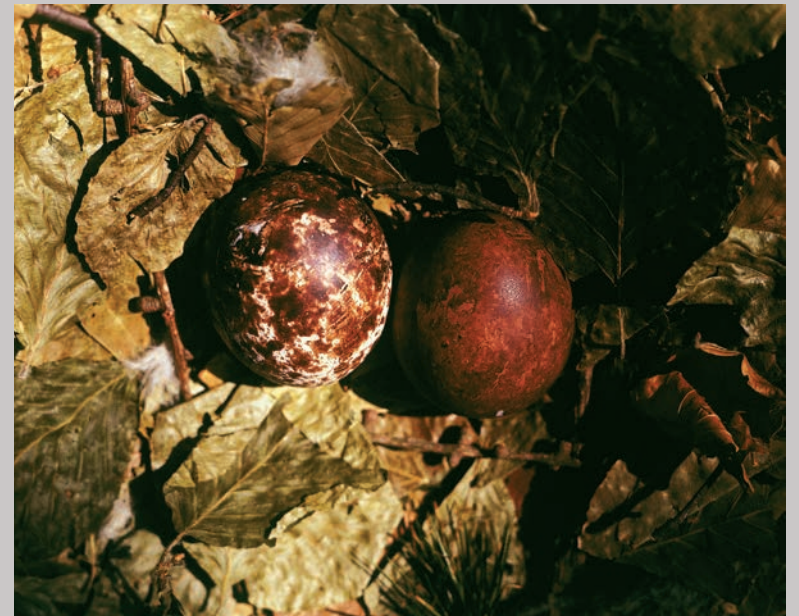
De smukke kastanjerfarvede æg i reden.