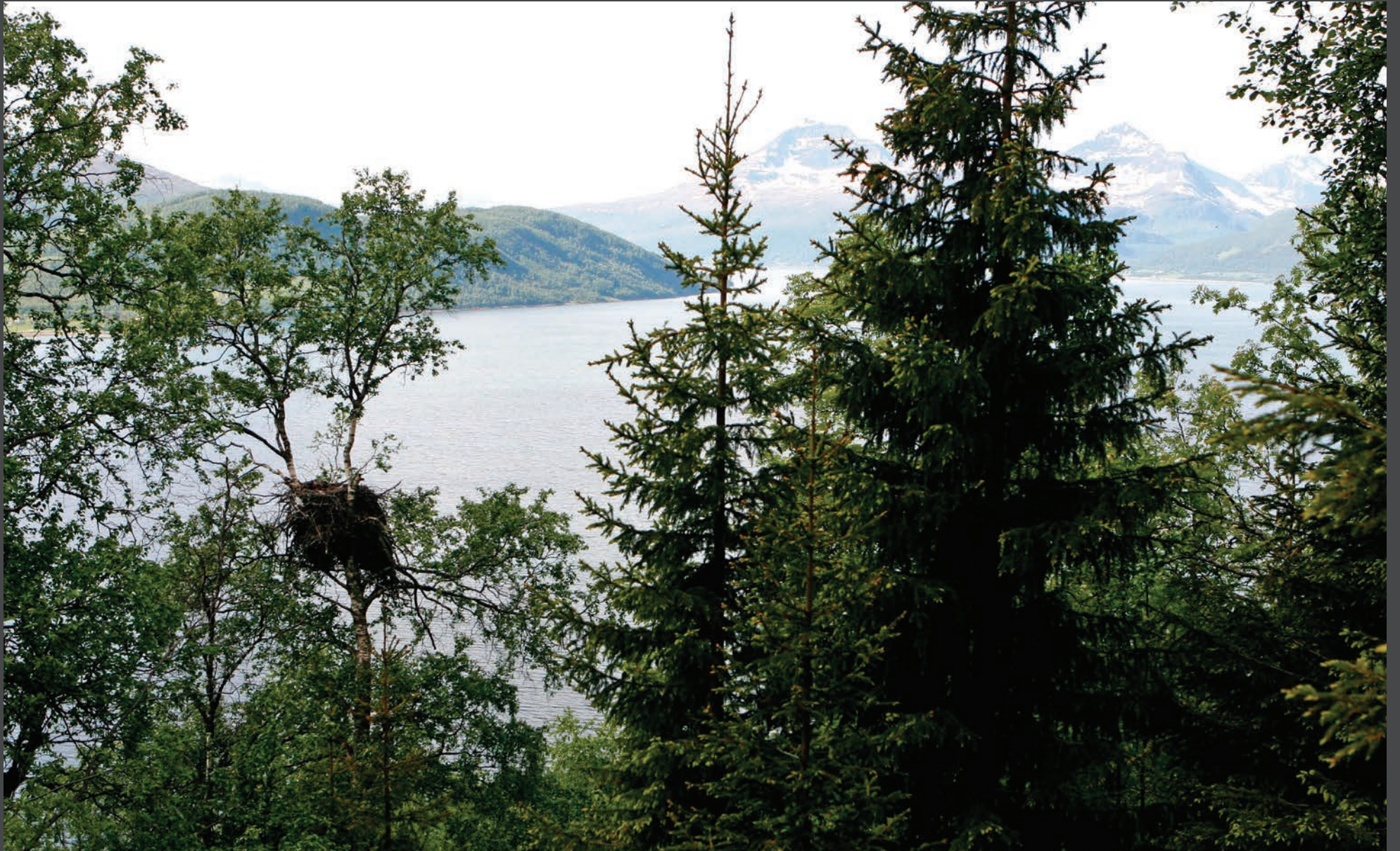
Den nordatlantiske havorns hjemland: Nordnorge.