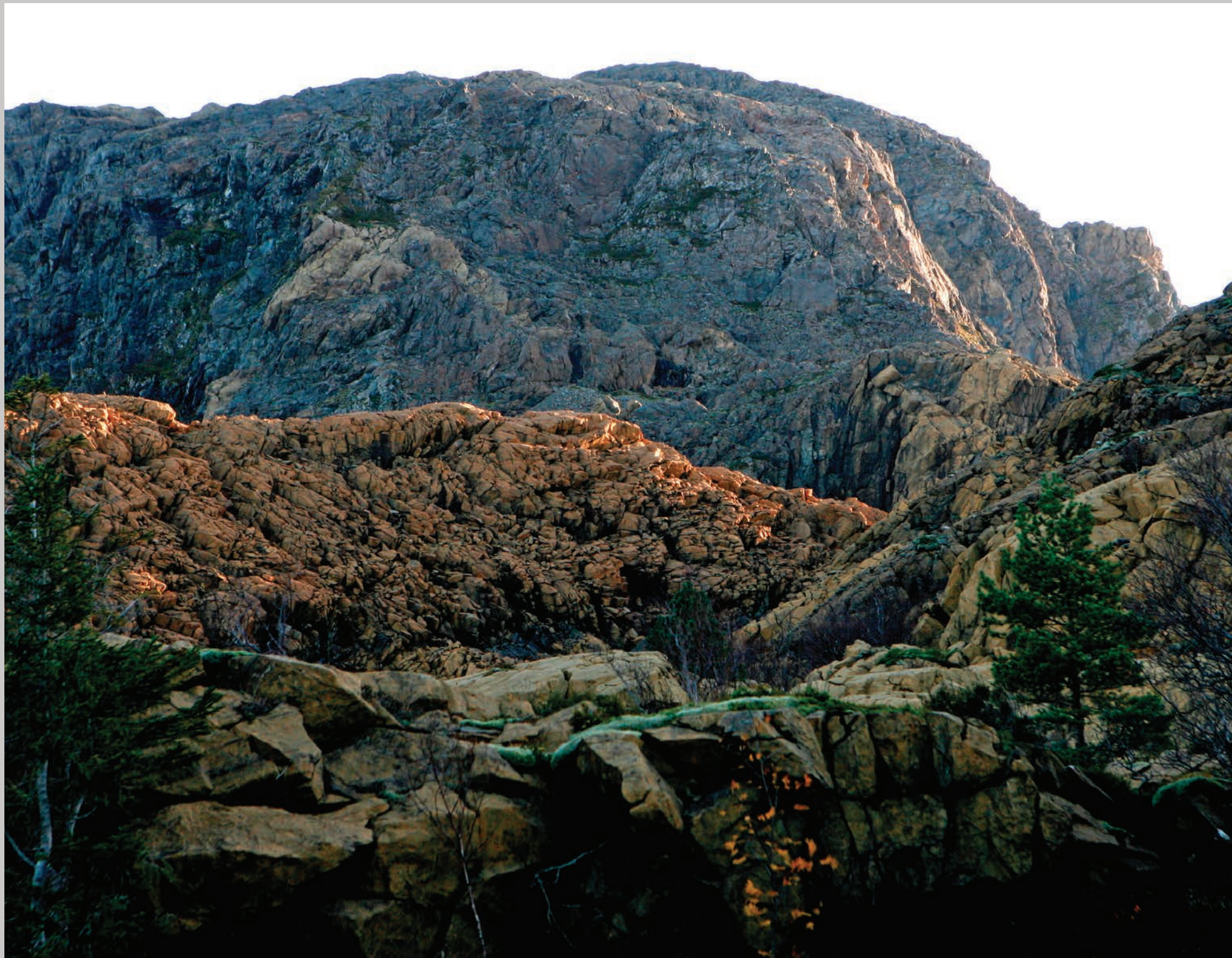
Fjeldet, hvor dramaet angiveligt fandt sted