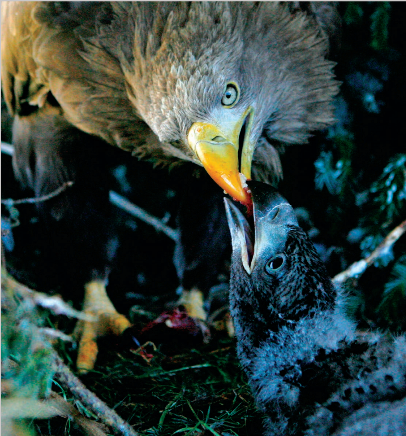
Margrethe fodrer sin halvoksne unge.