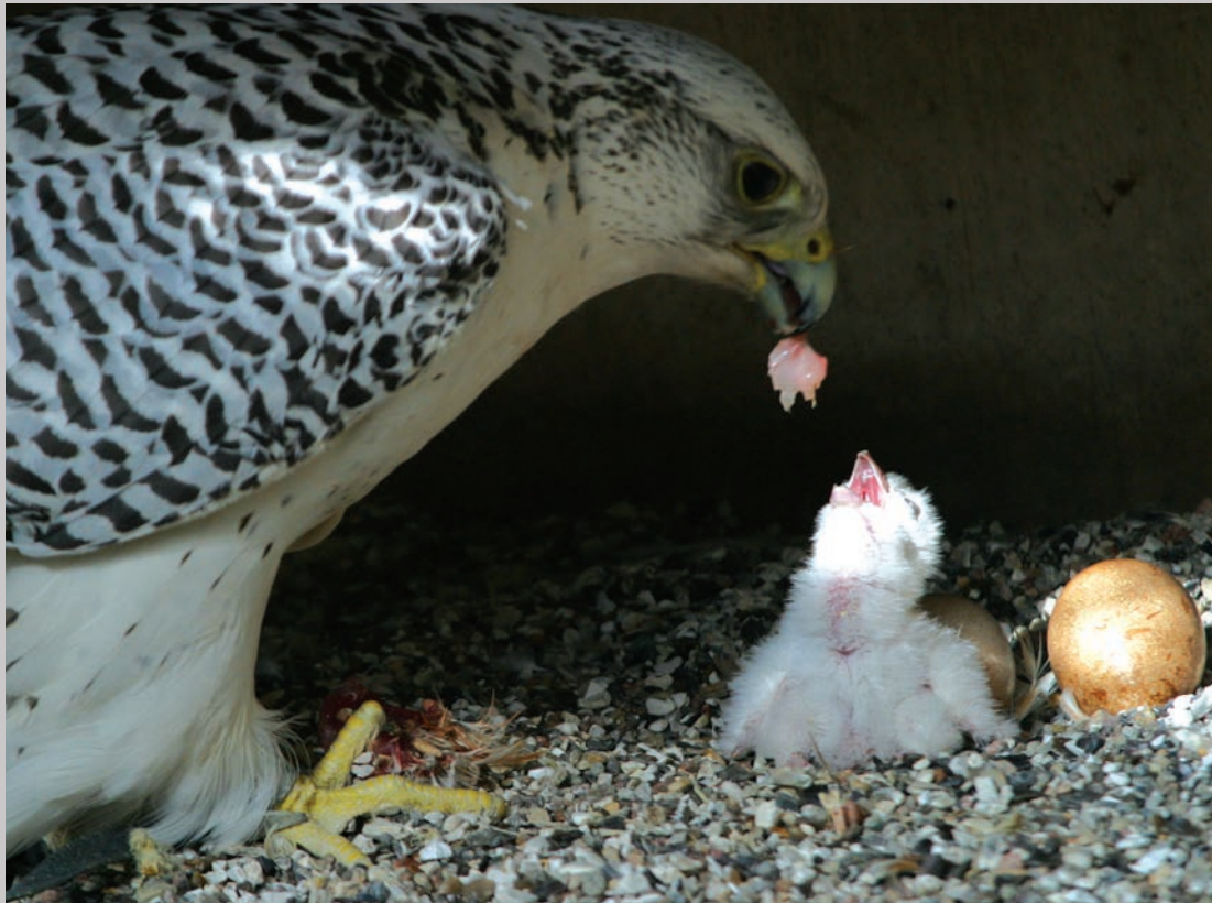
Hvid jagtfalkehun, der fodrer sin unge.