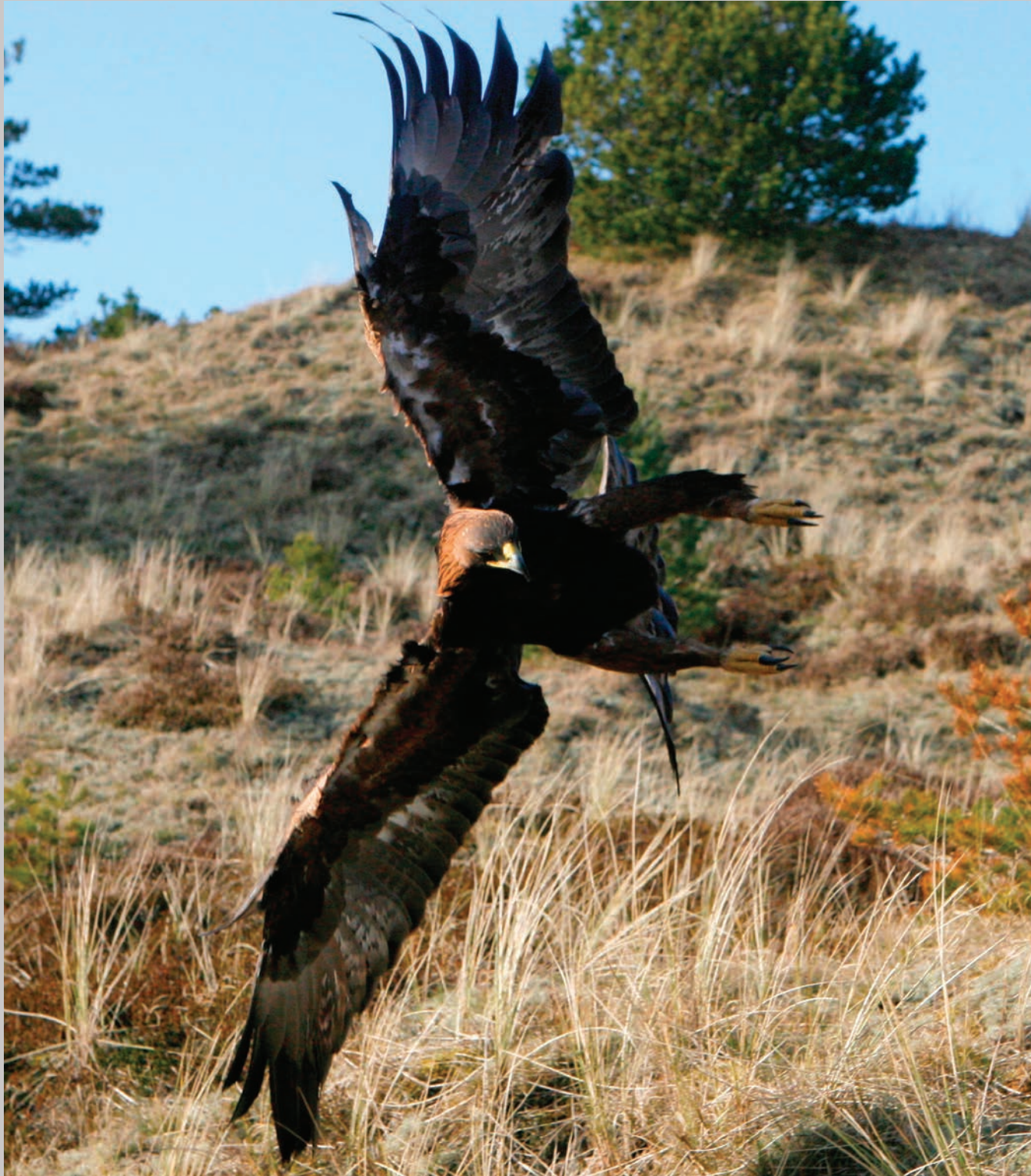
Kongeørn i angrebsflugt.