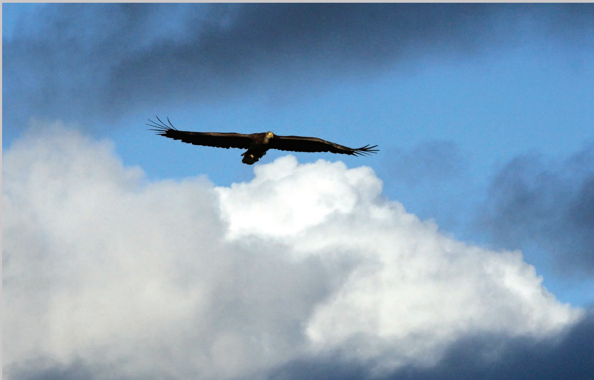
Havørn i glideflugt.