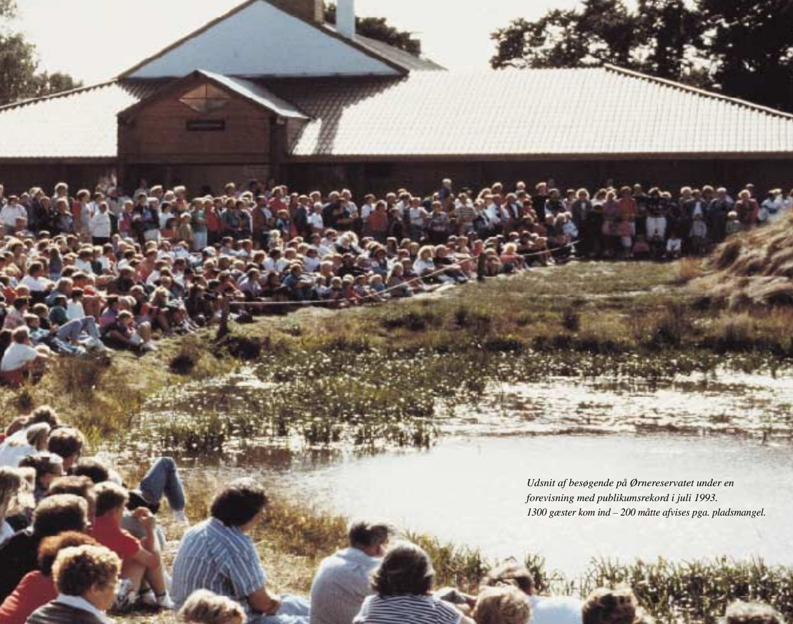
Udsnit af besøgende på Ørnereservatet under en forevisning med publikumsrekord i juli 1993. 1300 gæster kom ind – 200 måtte afvises pga. pladsmangel.