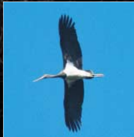
Den sorte stork fotograferet på himlen over Ørnereservatet, da den fløj sammen med havørnen Nøkke .