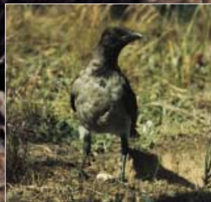
Ørnereservatets fastboende vilde krage, som holder vagt, informerer om nye gæster – og derfor går under navnet " Politibetjenten ".