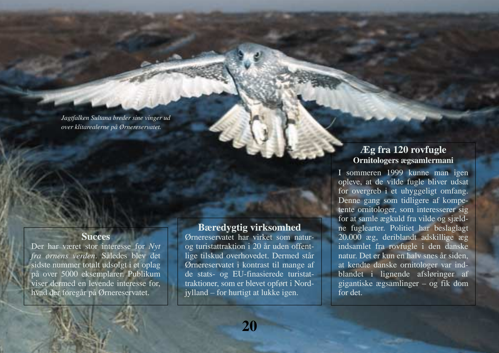
Jagtfalken Sultana breder sine vinger ud over klitrealerne på Ørnereservatet.

Et længe næret ønske gik i opfyldelse, da Ørnereservatet i 1999 fik lejlighed til at erhverve et enestående og fredet naturområde præget af store klitter og tilstødende hede og skovarealer. Naturområdet støder direkte op til Ørnereservatets øvrige område, og Ørnereservatets rovfugle har derfor fået endnu mere råderum over den uberørte natur. Samtidigt tilgodeses den vilde fauna, da der fremover ikke vil blive drevet traditionel jagt på dette område.