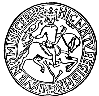
Segl fra Kong Knud II (Hellig Knud) 21. maj 1086 – viser falkejagts betydning i Danmarkshistorien.