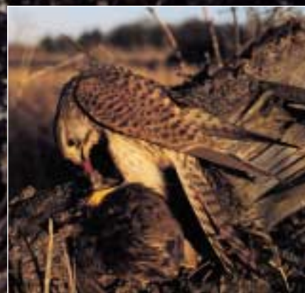
Tårnfalken er en af de vilde rovfugle, som oftest viser sine flyvefærdigheder under forevisningerne.