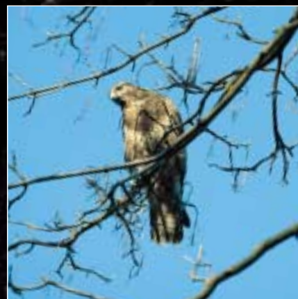
Musvågen er en hyppig gæst på Ørnereservatet, og den indgår dagligt i programmet.