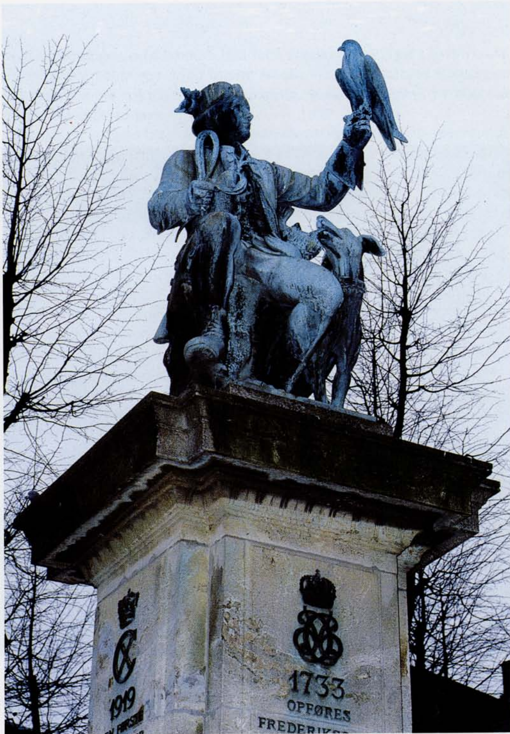
På Frederiksberg Allé finder man denne smukke falkonerstatue, som vidner om rige traditioner for falkonersporten i specielt Frederiksberg kommune, hvor det kongelige falkoneri lå indtil år 1810.