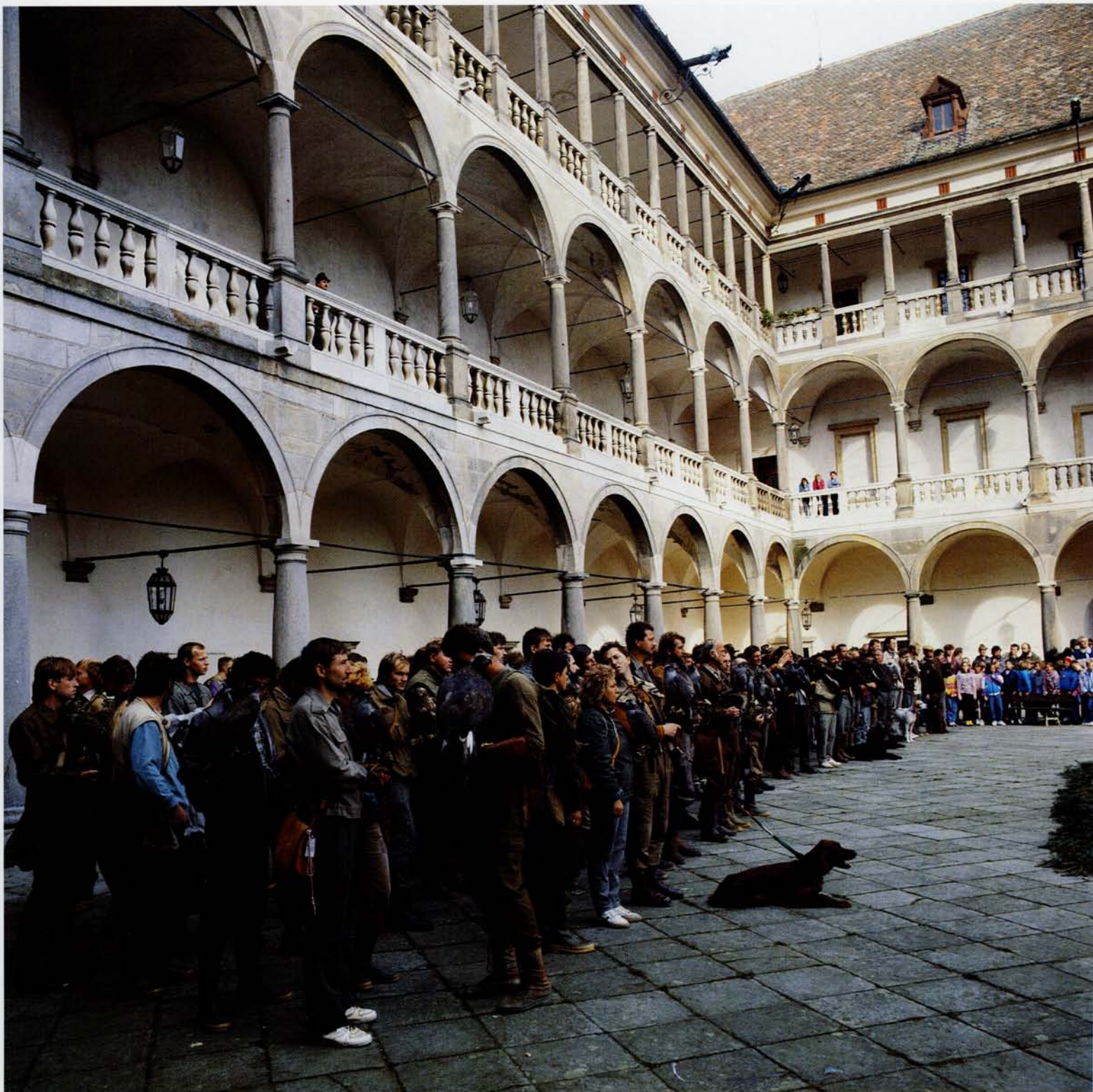
Morgensamling inden falkonererne tager ud i jagtrevirerne, Tjekkoslavakiet.