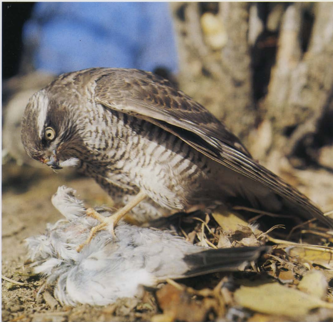
Spurvehøgen har her haft held til jagten og holder byttet i et jerngreb med sine lange gule fangere.