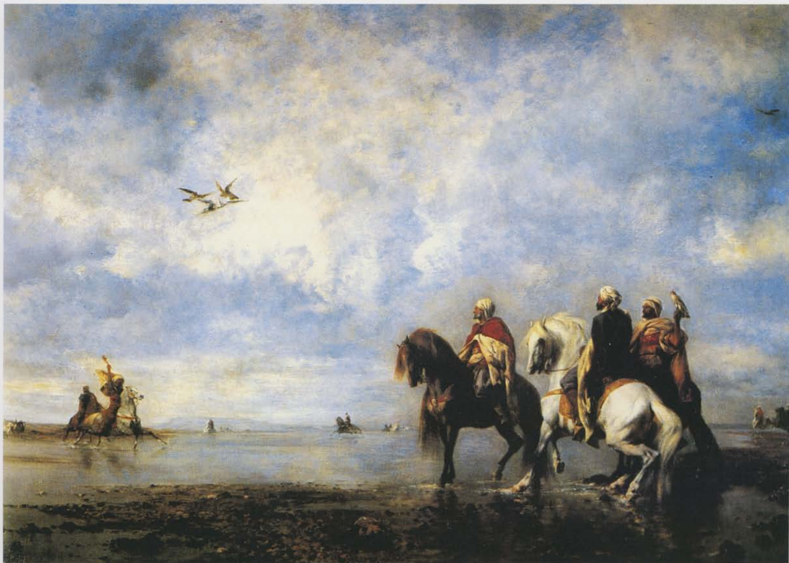
Hejrejagt i Algeriet. Falkene er gået op over hejren for at tvinge den til jorden. Oliemaleri af Eugène Fromentin fra 1878, Musée Condé, Chantilly.