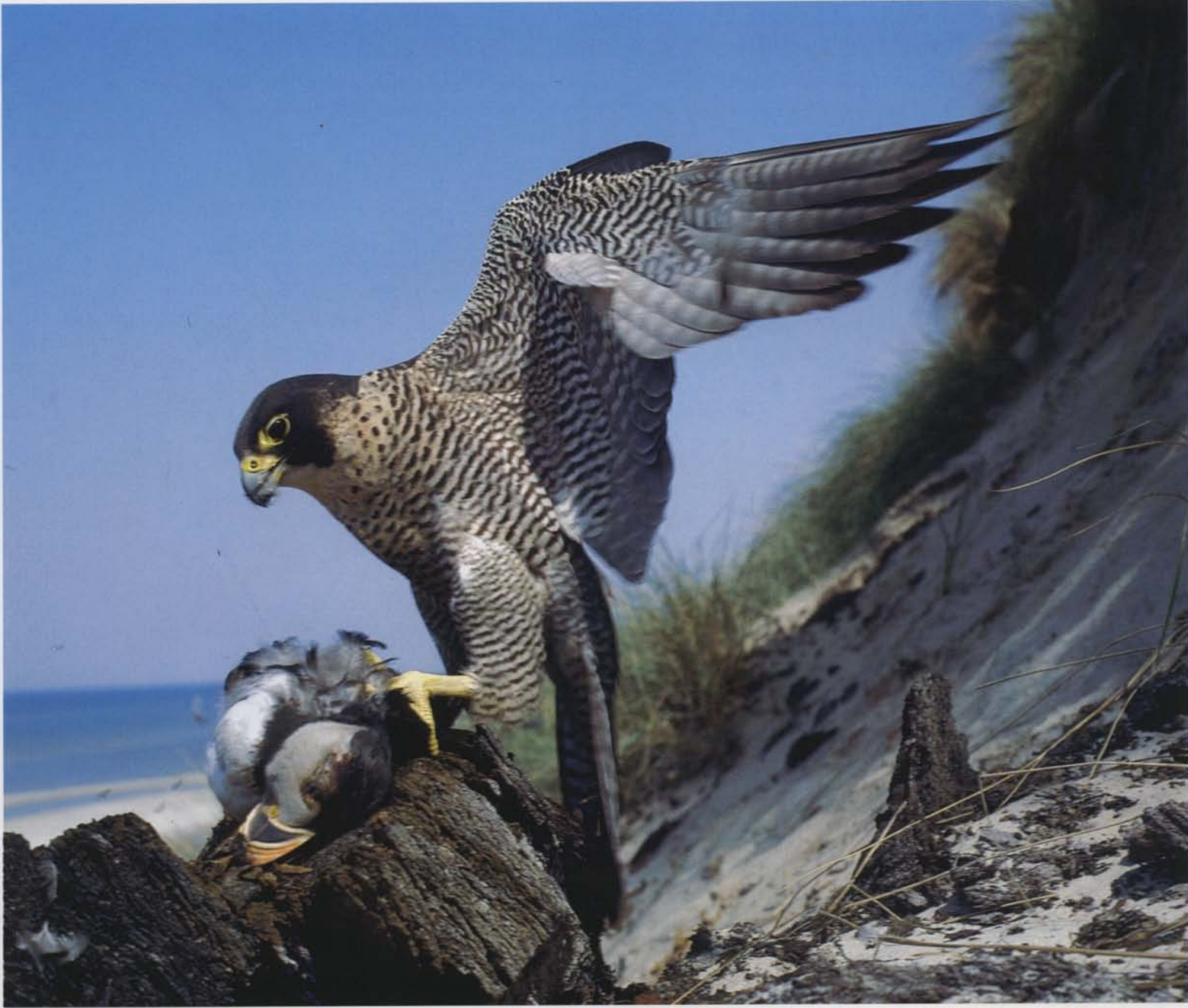
Gammel vandrefalkehun med bytte – en søpapegøje. Falkene bider nakken over, inden plukningen af byttet påbegyndes.