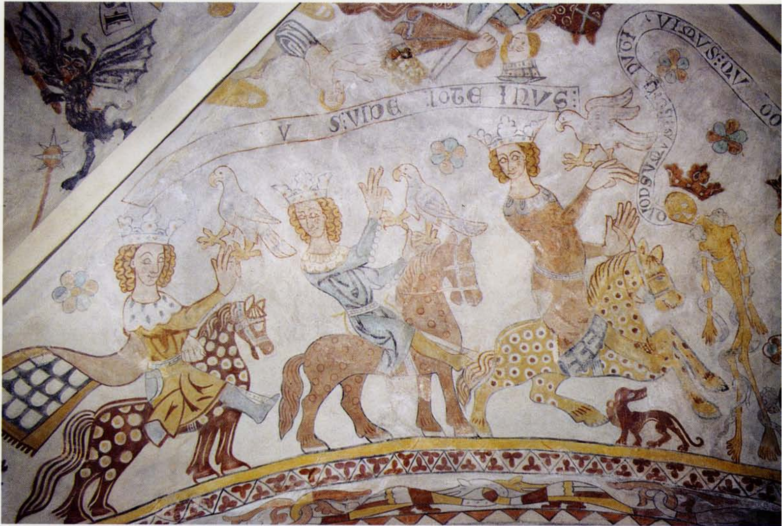
Skibby Kirke rummer bl.a. dette smukke kalkmaleri fra 1300-tallet, som i mange hundrede år var dækket af hvidt kalk. 3 konger rider afsted på jagt med deres falke og hunde. Djæveln lurer, og døden truer. En påmindelse om at livets glæder ikke varer evig – selv ikke for konger.