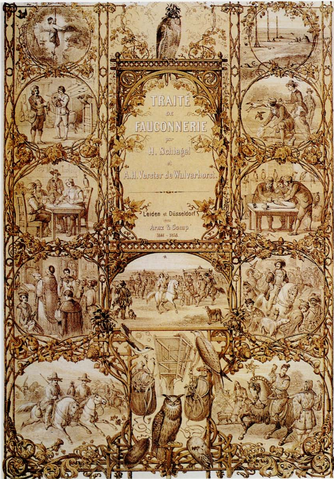
Titelblad fra bogen Traité de Fauconnerie af Schlegel og Wulverhorst fra 1800-tallet. De forskellige scener viser bl.a., hvordan man fik fat i rovfuglene, træningen og tilsidst selve jagen.