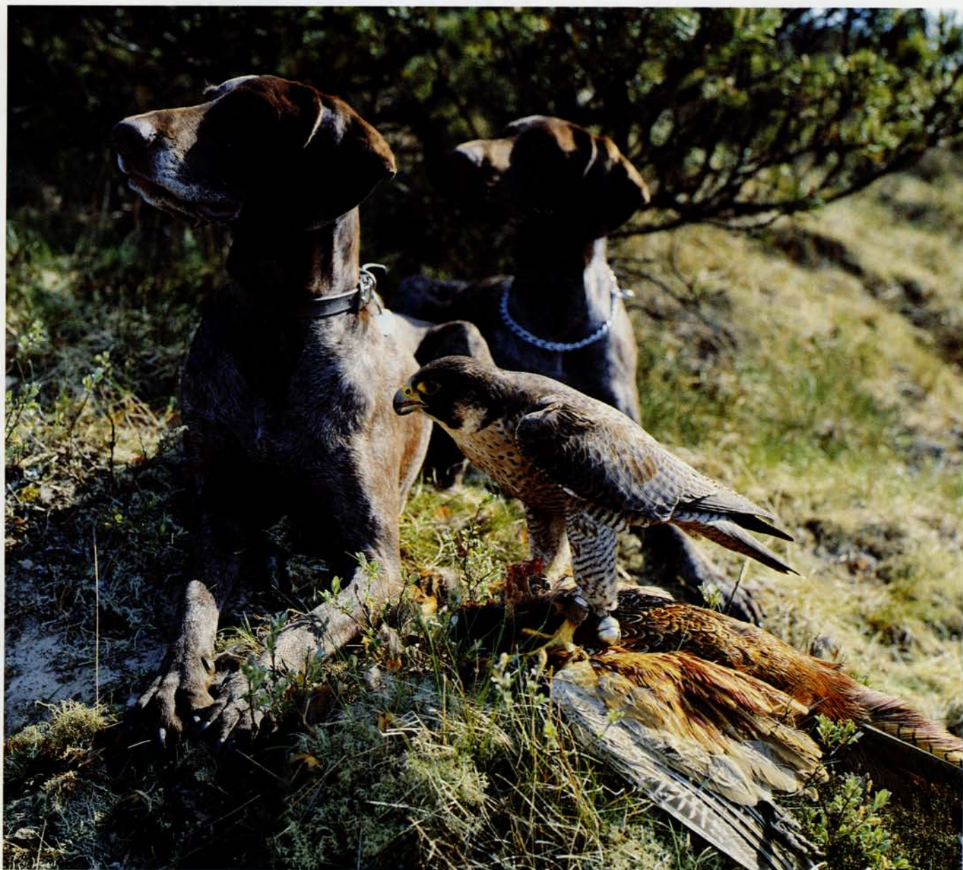
Vandrefalk med bytte. De to tyske korthårs jagthunde venter lydigt på falkoneren.