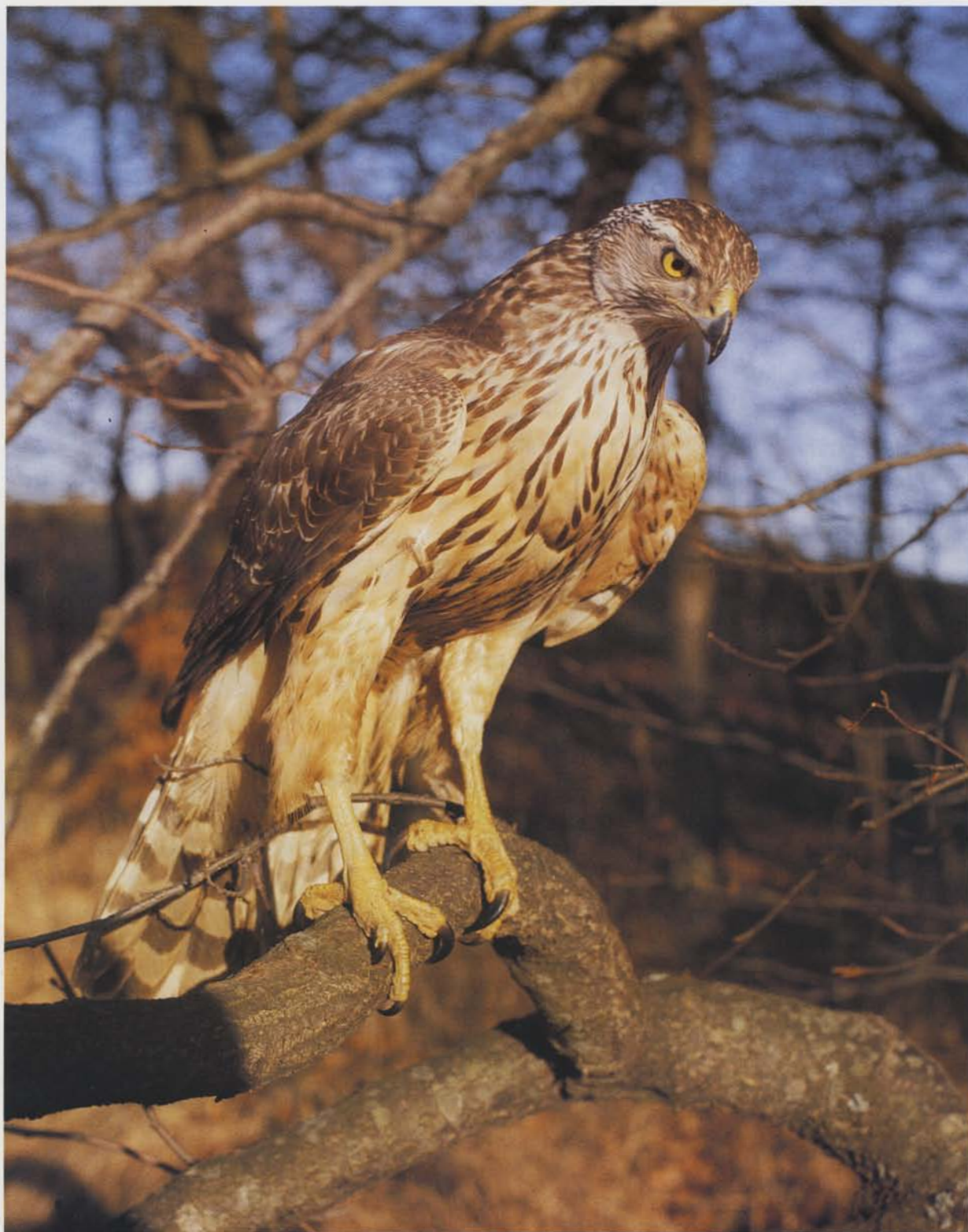
Ung duehøg på udkig i skoven. Bemærk de kraftige ben og fangere, som er det redskab høge og ørne bruger til at dræbe byttet med.