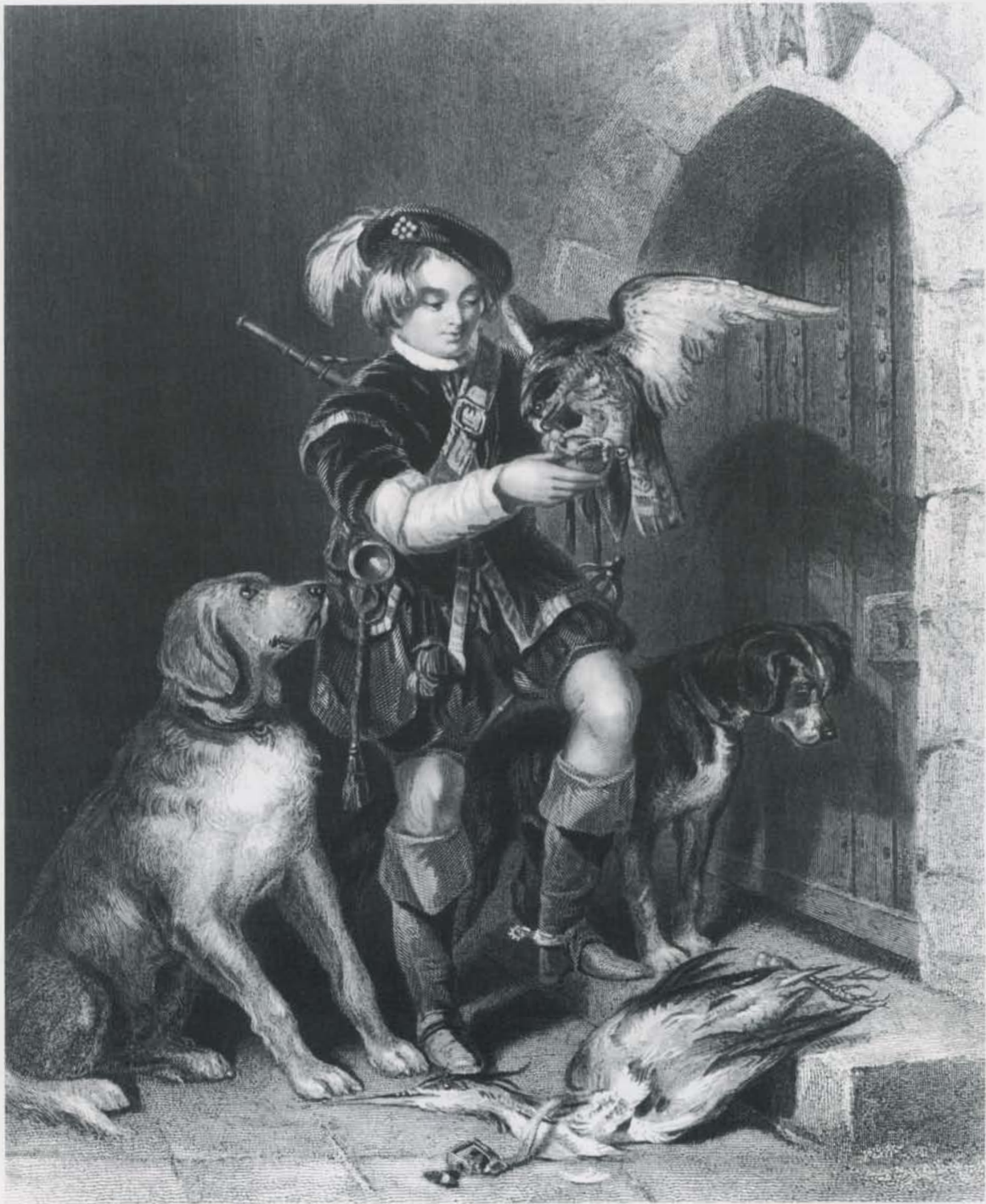
En ung falkonerdreng med sin duehøg og jagthunde. I mere end 1000 år har falkonerkulturen været et vigtigt led i opdragelsen af ungdommen blandt den toneangivende klasse.