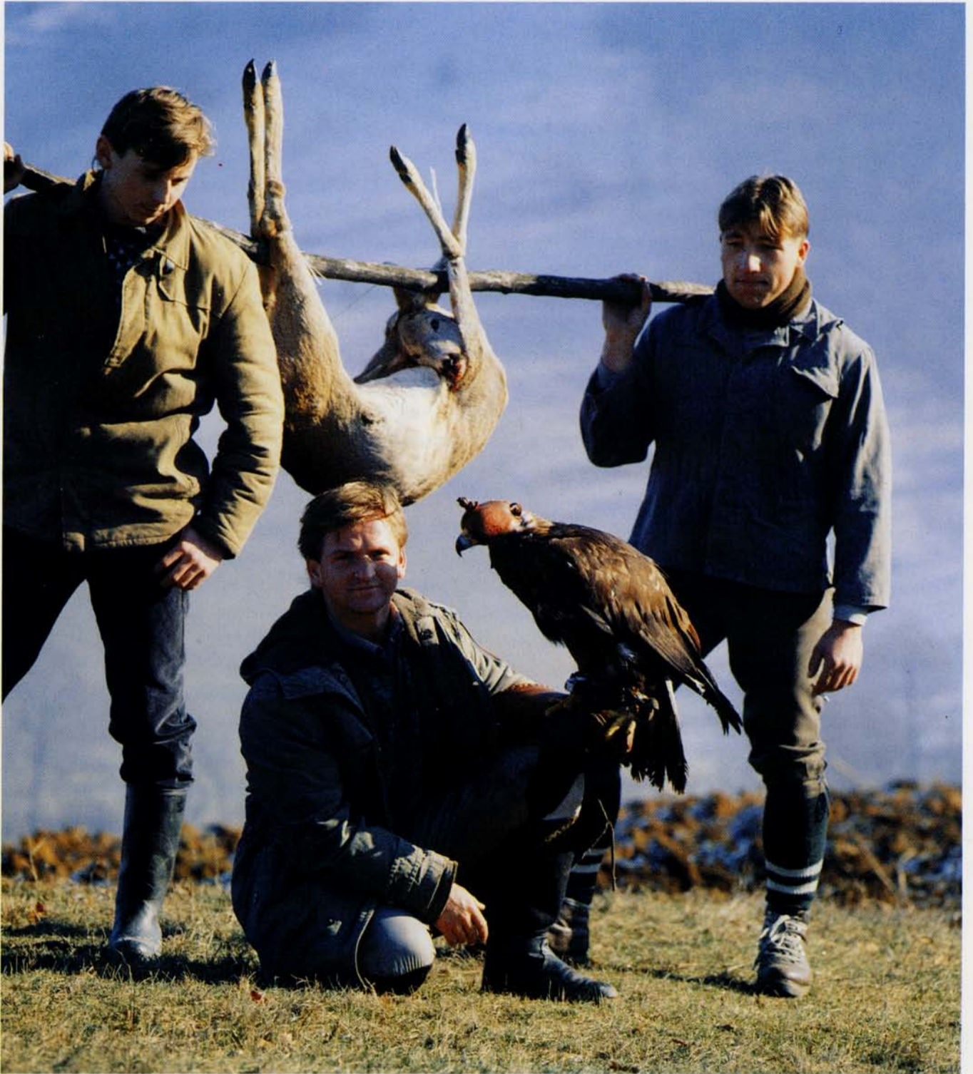
Slovakisk falkoner med sin kongeørnehun som lige har nedlagt et rådyr.