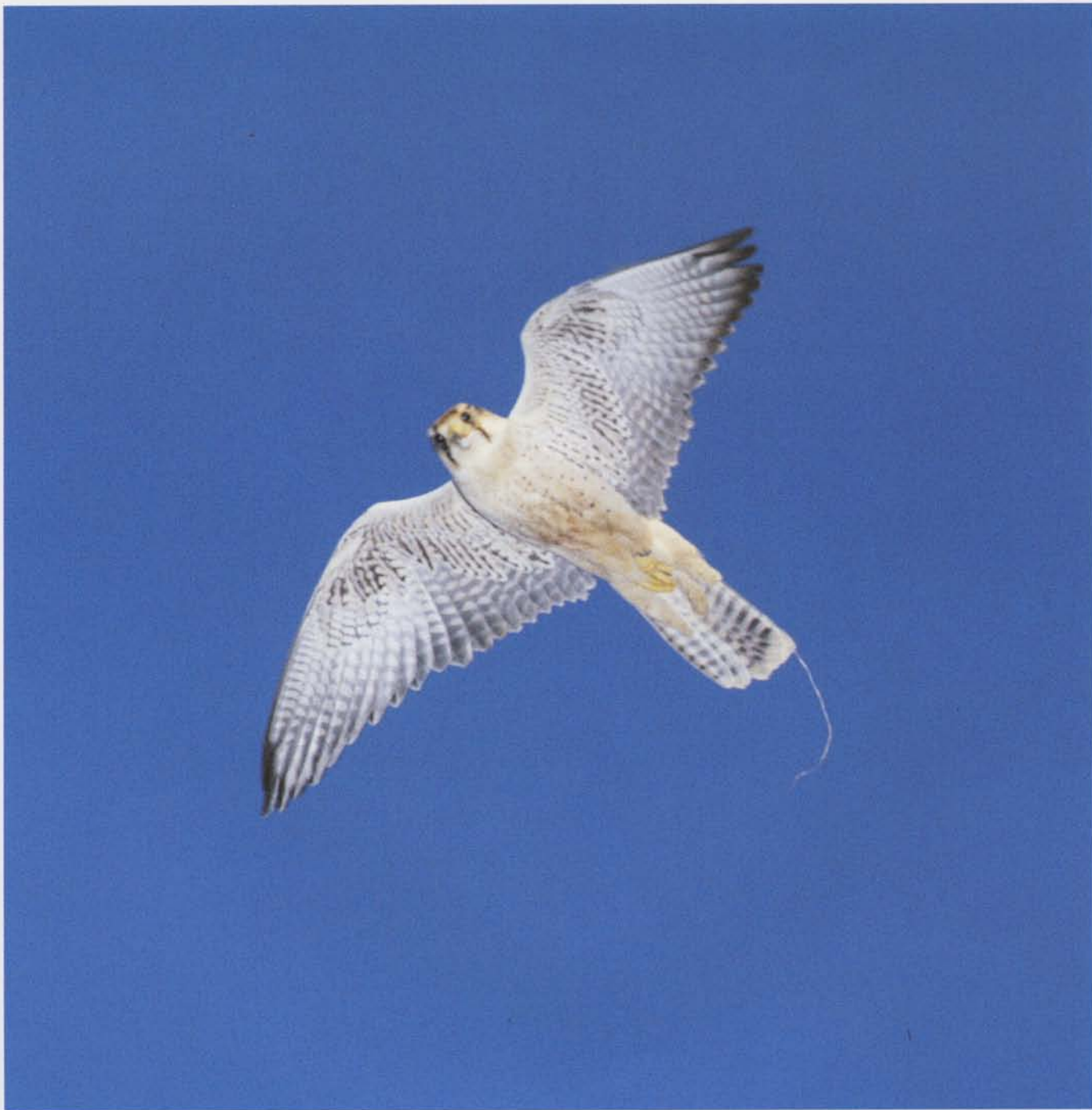
Lannerfalken har gode flyveevner, men er ikke så almindelig blandt falkonerer.