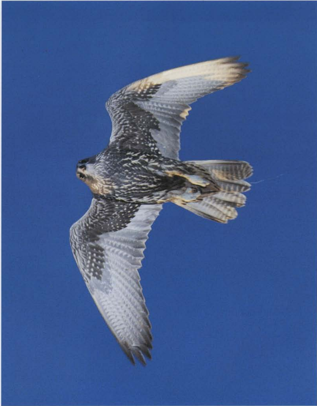
Jagtfalken kan i horisontal flugt opnå en hastighed på op til 130 km/t.