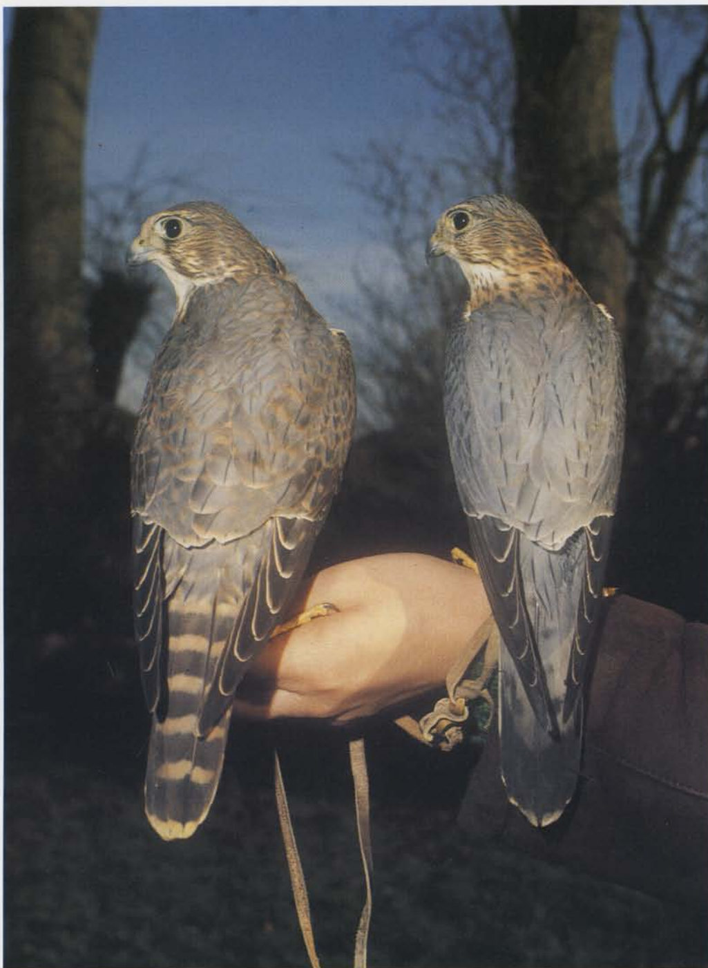
To dværgfalke (han og hun). Hunnen er den største med de tydelige tværbånd på halen.