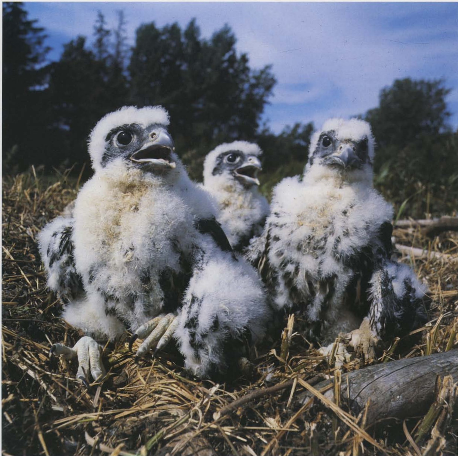
Jagtfalkeungerne er, som alle andre rovfugleunger, ganske hjælpeløse og helt afhængige af forældrenes jagtheld.