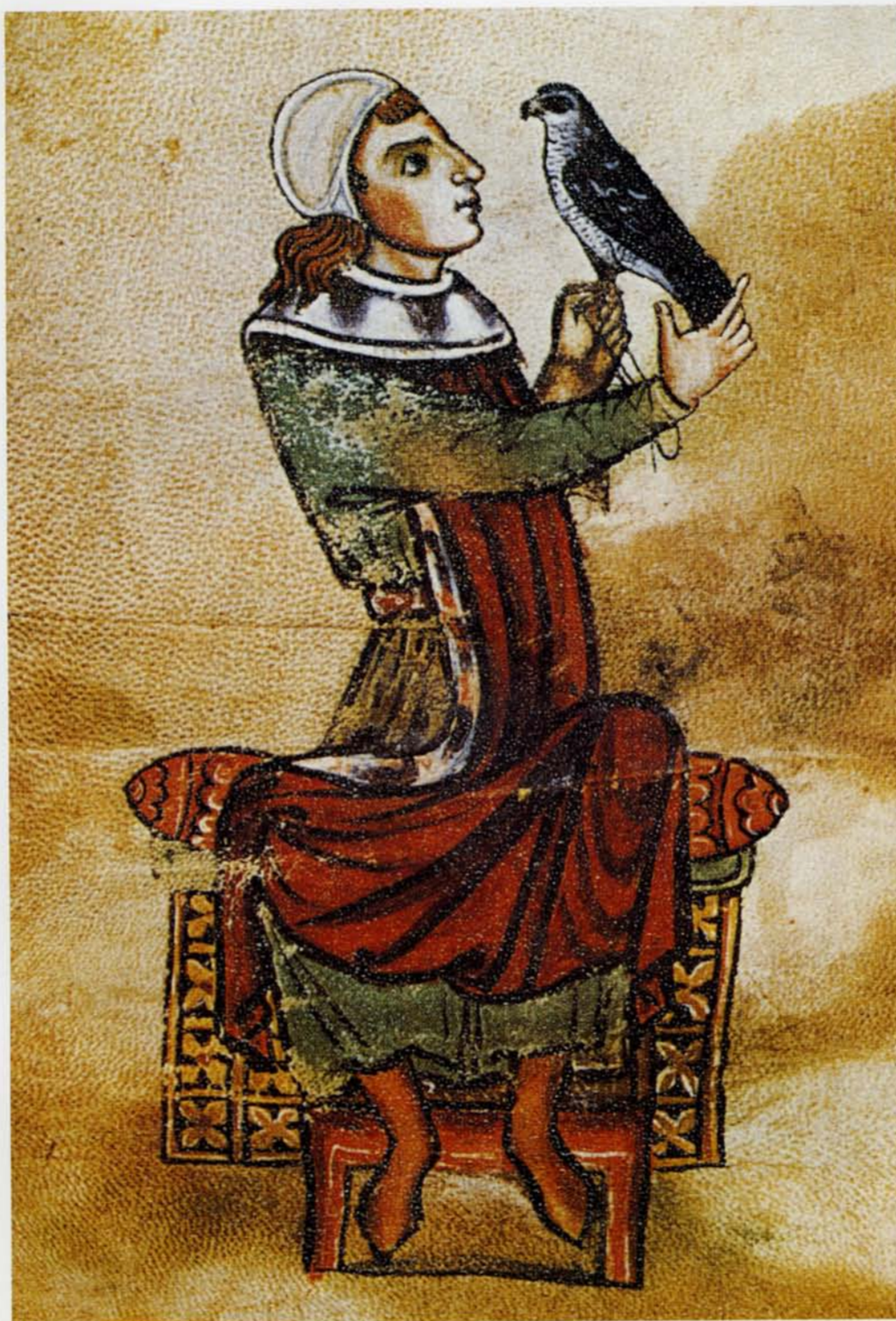
Frederich II's bog viser i detaljer de forskellige led i træningen af falkonerens jagt fugle. Her viser falkoneren falcken tilrette på handsken ved let at berøre halen. Falken vil da vende rigtigt med front mod falkoneren.