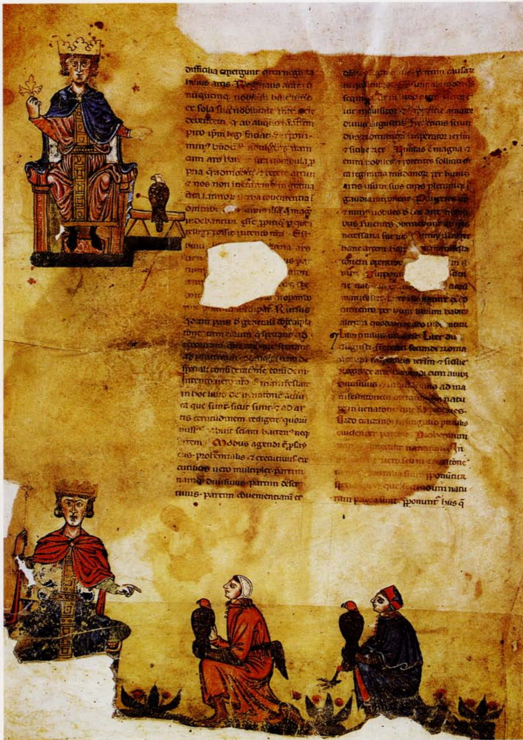
Illustration fra Frederich II af Hohenstaufens bog "De Arte Venandi Cum Avibus" (Kunsten at jage med fugle) fra 1200-tallet viser 2 falkonerer, som har foretræde for den mægtige tysk-romerske kejser.