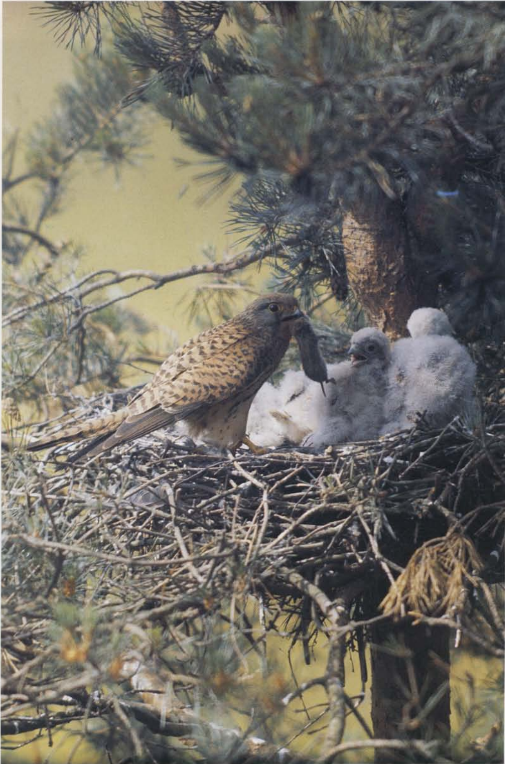
Tårnfalk i færd med at fordele byttet – en markmus – til det store kuld unger. Tårnfalken er den mest almindelige falk i Danmark og i det øvrige Europa.