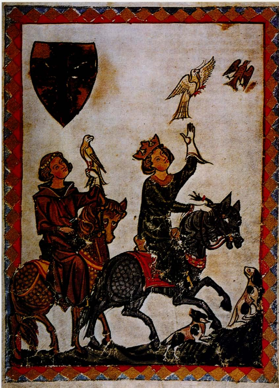
Kong Codradin på falkejagt med sin falkoner. Illustrationen stammer fra værket om Codradins bedrifter (år 1268). Bogen bevares i dag på Heidelberg universitets bibliotek.