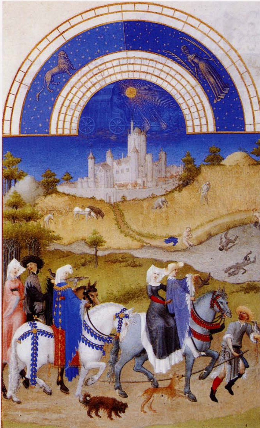
Kalenderblad for august måned malet af Jacquemarrt de Hesdin og Paulde Limborug i perioden 1384–1411 til kunstbogen "Les Très Riches Heures du Duc deBerry". August var måneden, hvor falkejagtsperioden begyndte. Falkonererne har her dværgfalk og spurvehøg med, og manden med den lange stok skal måske jage agerhøns og vagtler op fra kornmarkerne.