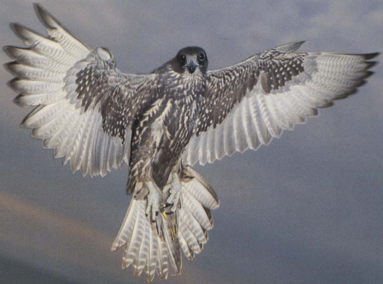
Jagtfalken (mørk fase) – den største af alle falke – her på udkig efter bytte.