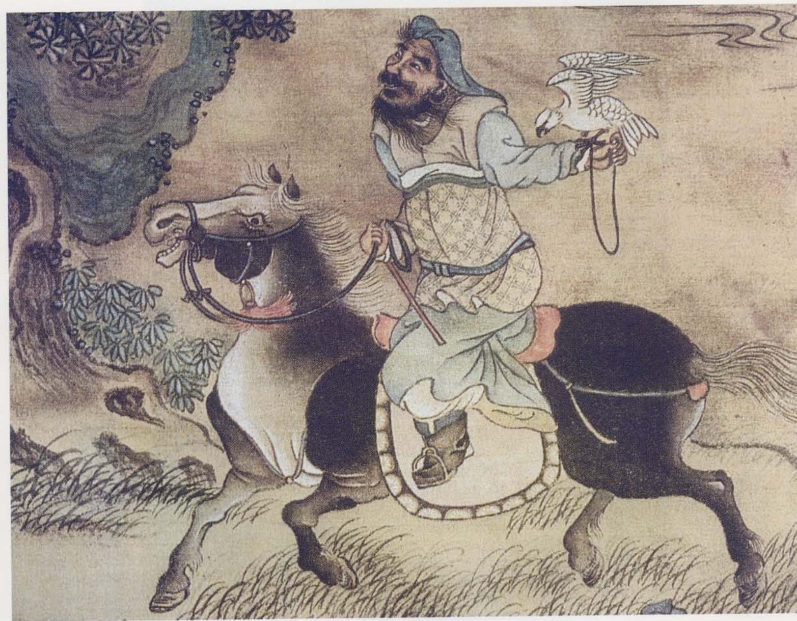
Djengis Khan som kineserne opfattede ham på denne miniature fra et museum i Tyrkiet. Djengis Khan er her på jagt med en hvid jagtfalk.