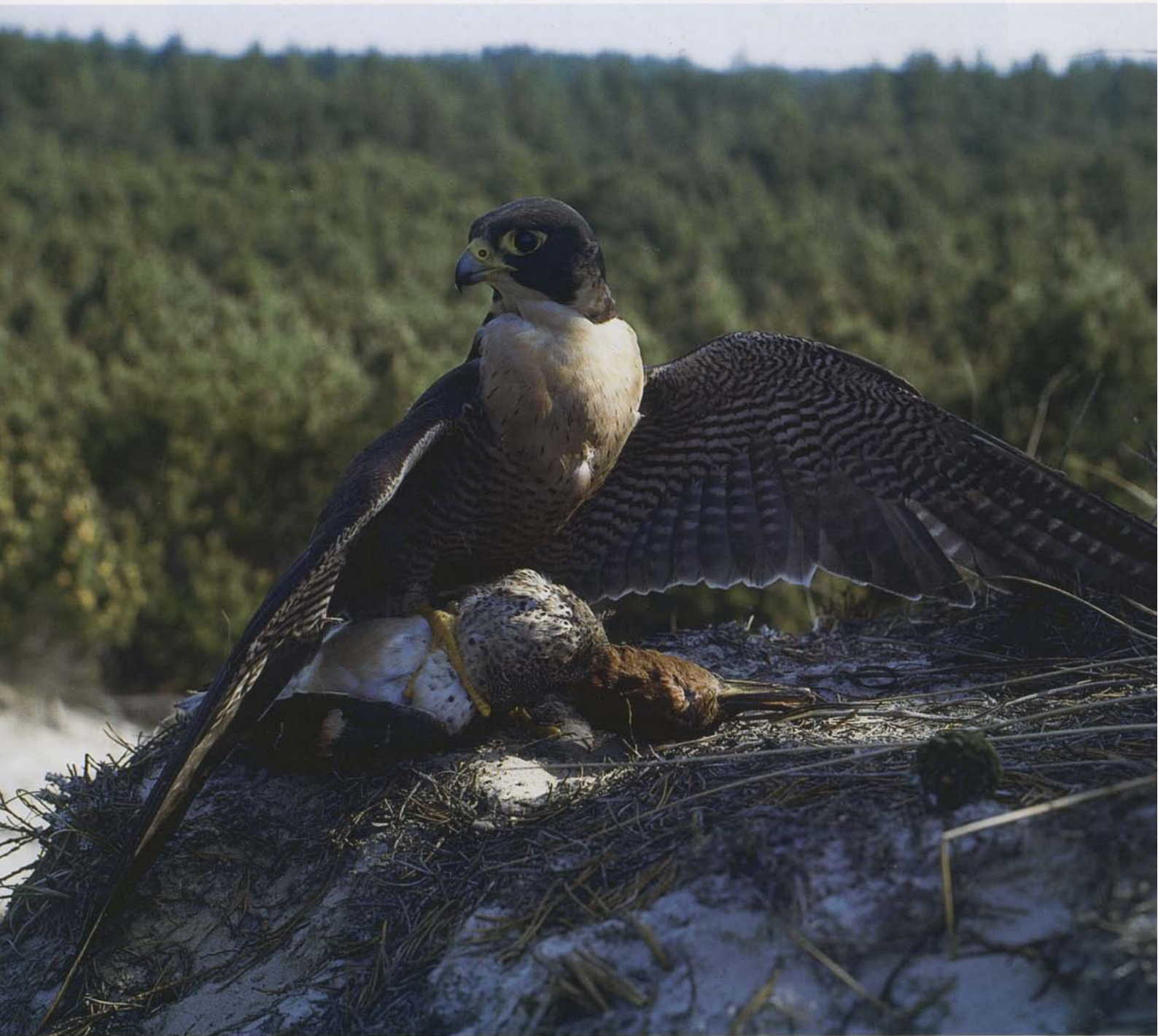
Gammel vandrefalkehan med bytte som skjules for fjender og konkurrenter under falkens vinger.