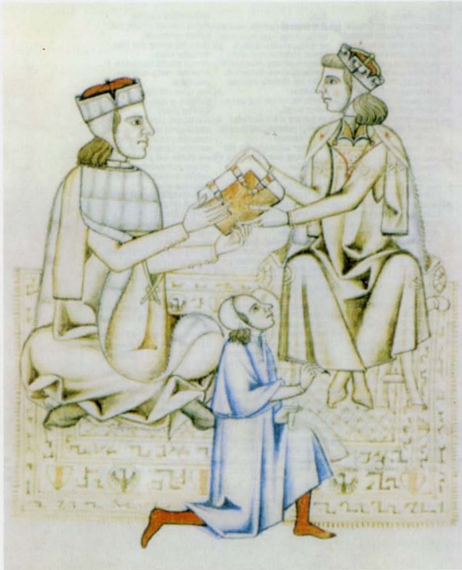
Frederich II af Hohenstaufen modtager første udgaven af det store værk "Kunsten at jage med fugle", som han selv har skrevet efter mange års forskning og samtaler med de førende eksperter på området. Værket var rigt illustreret med fine farvetegninger, som kejseren selv havde lavet.