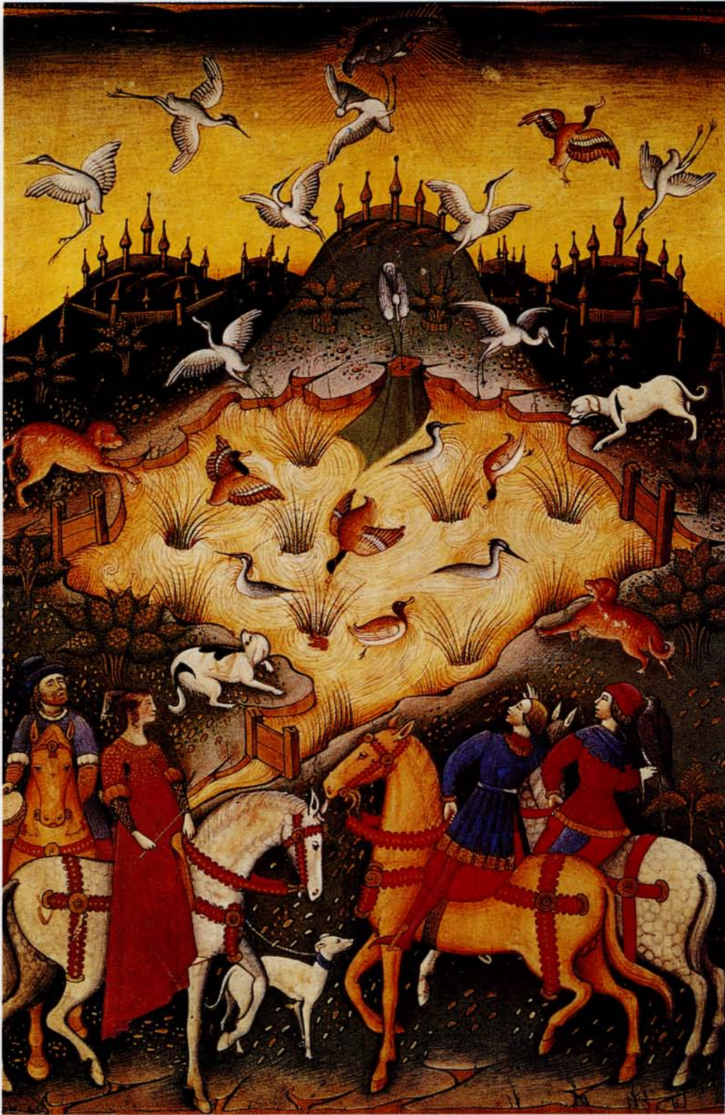
På Musée Condé, Chateau de Chantilly finder man adskillige smukke illustrationer om falkejagten. Her ses den nok så populære jagt på hejrer, traner og andre vandfugle. Bemærk hvor højt falken er nået op i himlen – og er det en aura, eller er det blot solens stråler, man kan se lyse.?