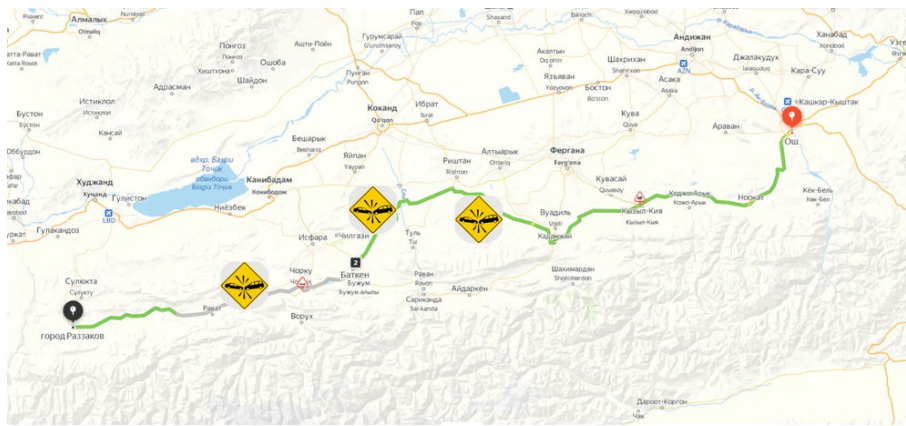
Участок дороги Ош-Баткен-Раззаков, где чаще всего происходят ДТП