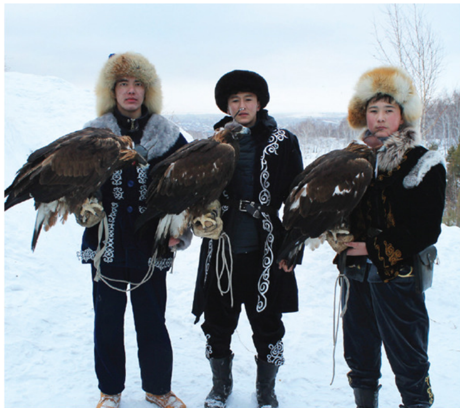
Участники десятого чемпионата Казахстана среди беркутчи «Кансонар-2015»

терпения и выдержки, к тому же необходимо внимательно следить за физическим состоянием птицы, контролировать вес, развитость ног и грудной клетки. Другими словами, мастерство беркутчи – это многогранное искусство, полное секретов, именно их умело демонстрировали зрителям и судьям все участники юбилейного чемпионата.