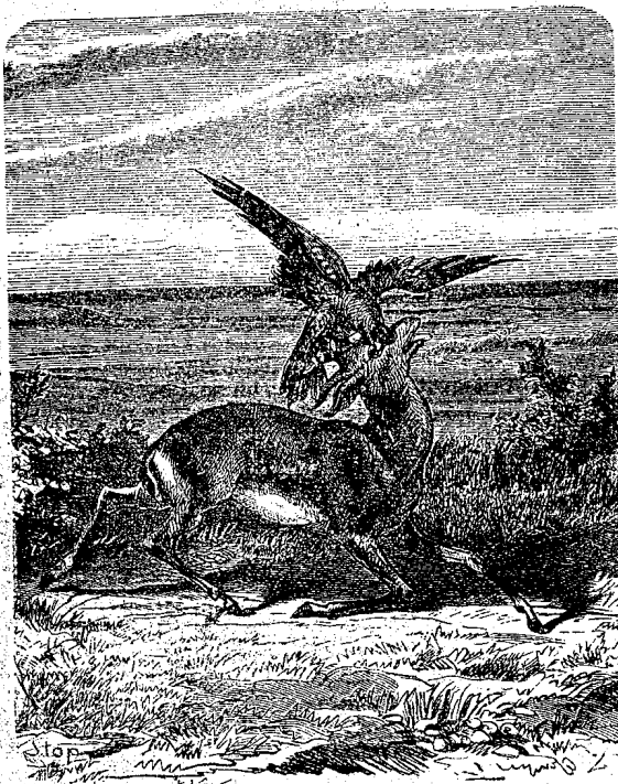
Ловъ на газели.

разенъ дивечъ. Така, въ VIII вѣкъ, английскиятъ царъ Етелбертъ писалъ на Майнския епископъ Бонифацио да му изпроводи единъ чифтъ отъ неговитѣ соколи, дресирани специално за ловъ на жерави. Въ 800 година, Шарлеманъ е издалъ царска заповѣдъ, че „който убие или открадне единъ обученъ за ловъ на жерави соколъ, е длъженъ да го замени съ другъ добръ изученъ и да плати глоба 5 денара“). За по-прости соколи и ястреби, глобата е била отъ 1—3 денара. Императоръ Фридрихъ Барбаруса до толкова е билъ прѣдаденъ на този спортъ, че самъ е обучавалъ соколитѣ си; а пѣкъ Фридрихъ II е минавалъ за най-компетентенъ по соколекия ловъ. Отъ него има и едно съчинение по този прѣдметъ. Той така много е билъ пристрастенъ къмъ това удоволствие, че дори и въ врѣме на война не се отдѣлялъ отъ любими-тъ си соколи, като не прѣставалъ да ги пуца по жерави, чапли и яребици, прѣдъ очитѣ на неприятеля. Въ врѣме на Акснската обсада, френскиятъ царъ, Филипъ-Августъ, напраздно прѣдлагалъ на турцитѣ хилядо златни монети, за да му повърнатъ сокола, когото случайно бѣха уловили. Този фактъ ни показва до каква висока цѣна сж достигали добръ обученитѣ соколи. Въ този спортъ, достойние на висшата аристокрация, не по-малко сж се увличали и дамитѣ, особено въ срѣднитѣ вѣкове. Това се вижда отъ приложената въ 103 стр. картина и отъ специалното съчинение, за лова съ соколи, на Димитриуса,