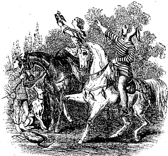
Ловъ на чапли въ срѣднитѣ вѣкове.

на султана; при това, тѣ сж се радвали още и съ политически права, наравно съ господствующето племе. Въ това балканско село имало двѣ класи селяни: доганджии 1) и раети 2) . Първитѣ сж старитѣ жители на селото, ползувавшитѣ се съ милоститѣ на сул-