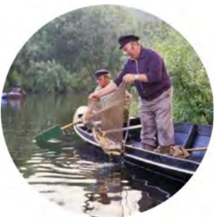
© Fischerei Bruderschaft zu Bergheim an der Sieg

Since 987, fisher families in Bergheim an der Sieg have fishing rights at the mouth of the river Sieg in the Rhine. Over the centuries, the community of these families became a religiously inspired, guild-like organized association, which is called brotherhood since the late Middle Ages and still has the fishing rights today. → continue reading