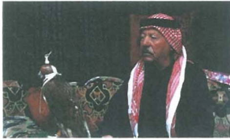
صيد الصقور، القائمة السورية للتراث