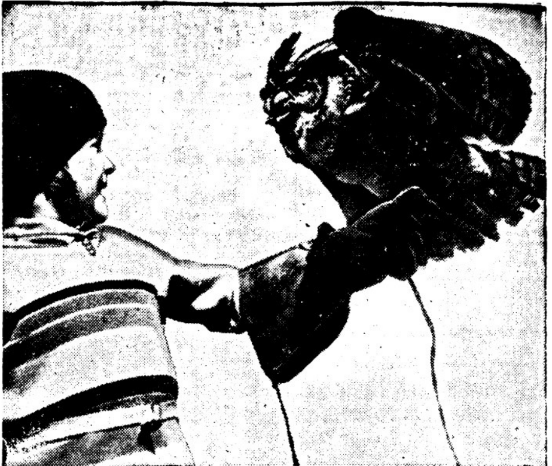
Nii hoitakse kulli käel.