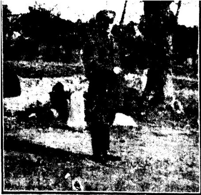
Kapten Orgussaar kulliga jahil.