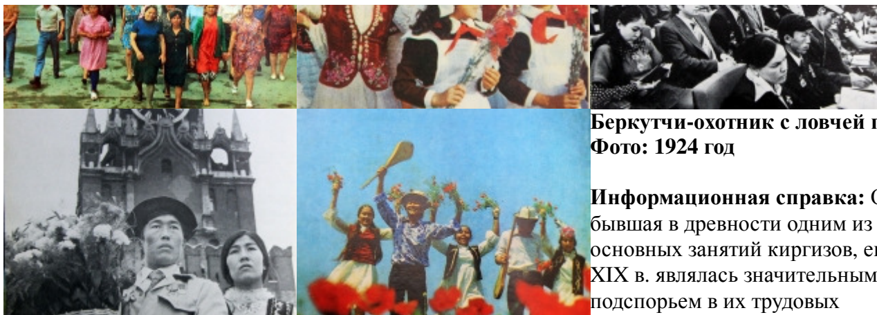
Беркутчи-охотник с ловчей птицей Фото: 1924 год

Информационная справка: Охота, бывшая в древности одним из основных занятий киргизов, еще в XIX в. являлась значительным подспорьем в их трудовых хозяйствах. В фольклоре