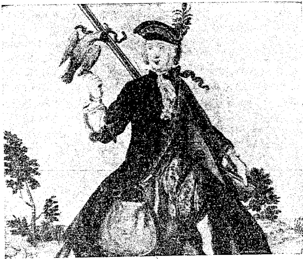
Голъмата страсть на баронеси и графини се е изразявала въ забага на ловъ съ соколи