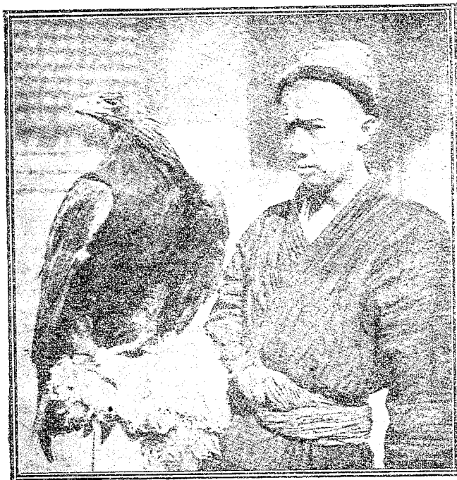
Младия ловецъ-киргизъ съ любимия си орелъ, чиято ловна страсть е добре използвана въ степитѣ.

Пражевалски и Муравѣвъ сж отивали съ персийскитѣ князе на ловъ по диви овни и козирози съ дресирани орли и описватъ много картинно преживелитѣ си, пълни съ крайно интересни борби на обученитѣ хищни птици съ голѣмитѣ си жертви. Козирозитѣ и дивитѣ овни (муфлони) обитаватъ най-стрѣмнитѣ карпи и гроходи, където обикновено пушатъ и дресирани орли. Въ такива недостъпни скалисти мѣста нито хора, нито обучени кучета се пускатъ следъ орела и затова той самъ и успешно