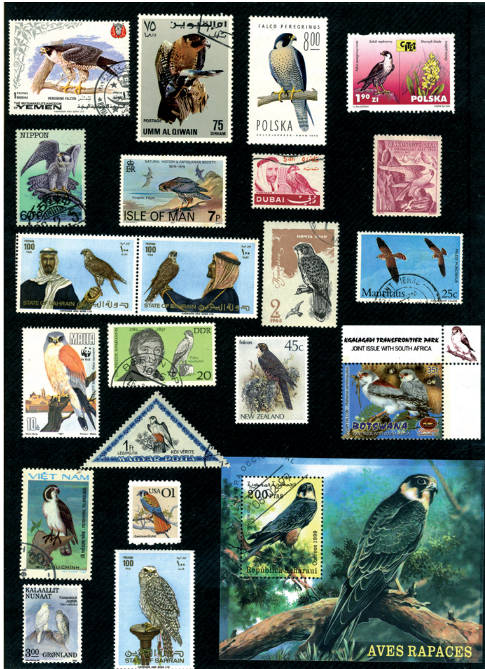
Ryc. 1. Sokóły na znaczkach pocztowych Fig. 1. Falcons on the postage stamps